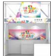
效果示意圖3D View (僅供參考)

展位數量 Apply for: 一個 One booth 兩個 Two booths 其他數量 Other quantities: _____