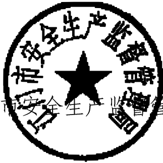
江门市安全生产监督管理局