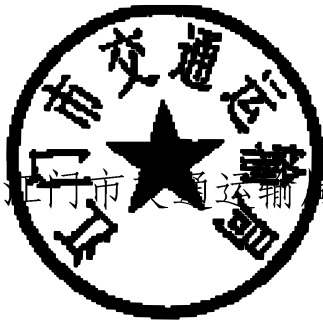
江门市交通运输局