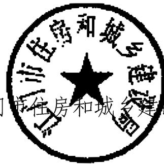
江门市住房和城乡建设局