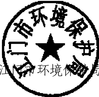
江门市环境保护局