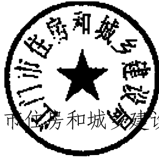
江门市住房和城乡建设局