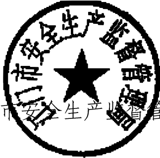
江门市安全生产监督管理局