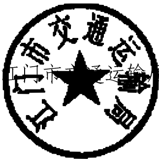
江门市交通运输局