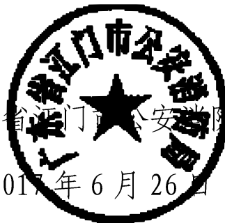
广东省江门市公安局