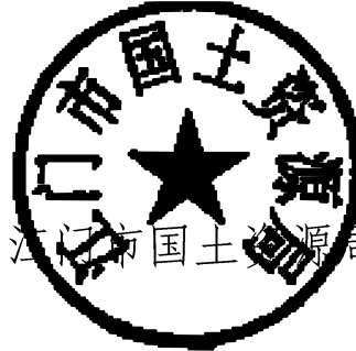
江门市国土资源局