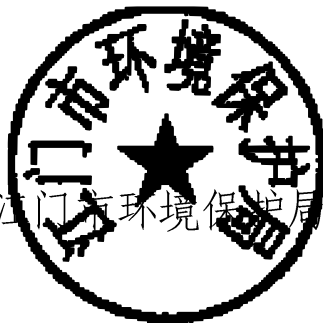
江门市环境保护局