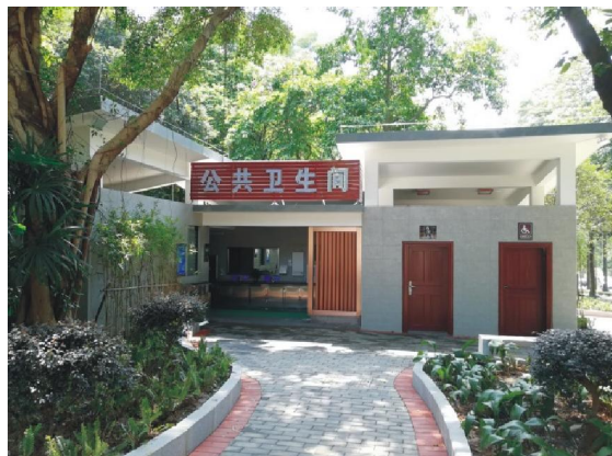
△白水带公园公厕升级改造前后对比