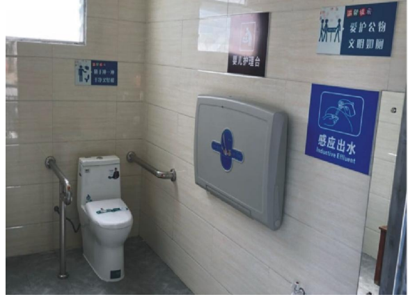
△陈少白广场公厕升级改造后外观、内饰