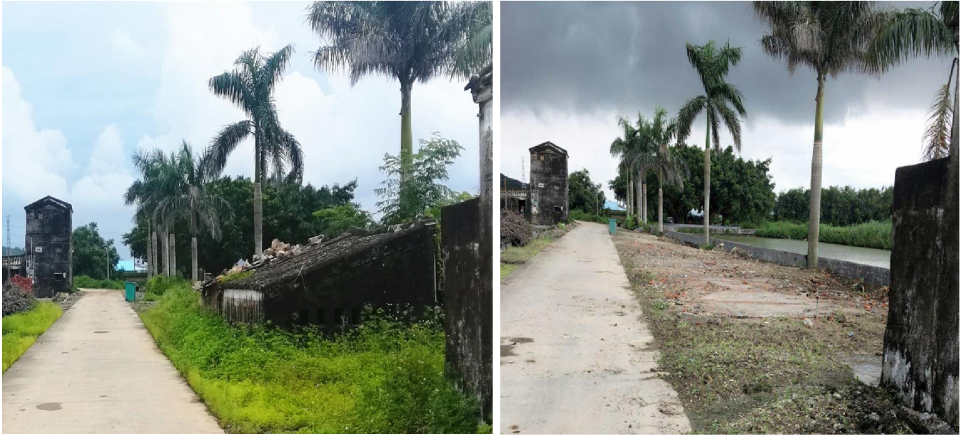
△广海双龙村委会双美村清拆前后对比