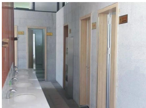
△新建龙溪湖公园公厕外观、内饰