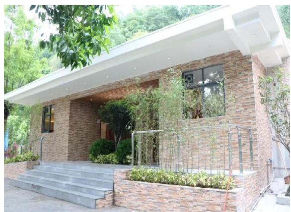
△江南文化广场公厕升级改造前后对比