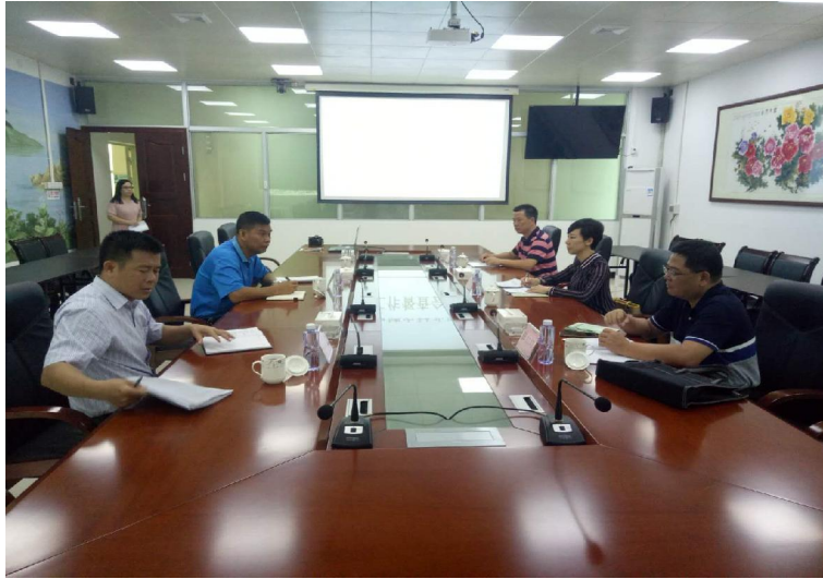
△海宴镇农村改厕座谈会现场