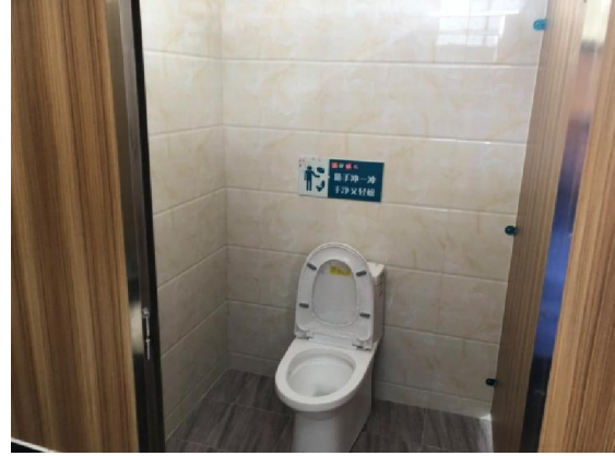
△礼乐威东村东华里公厕升级改造后