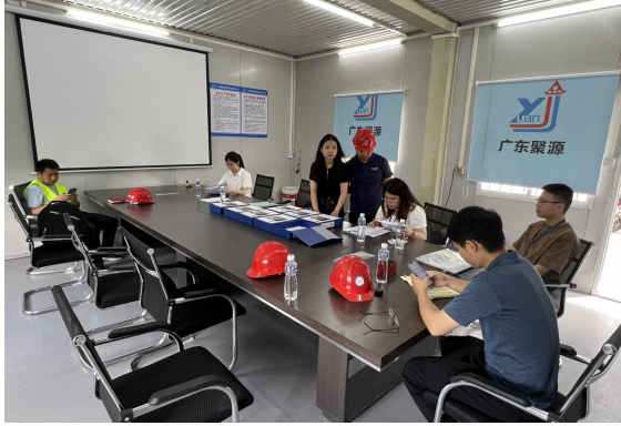
鹤山市住房和城乡建设局检查“中兴汇房地产项目一期（4栋、5栋、6栋、7栋）”

鹤山市住房和城乡建设局组织对“中兴汇房地产项目一期（4栋、5栋、6栋、7栋）”（项目建设单位江门市中兴汇房地产有限公司，施工单位广东聚源建设集团有限公司，监理单位鹤山市工程建设监理有限公司）开展“两场联动”检查。检查过程中，发现问题有：