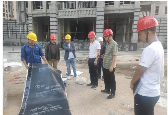
恩平市住房和城乡建设局检查“恩平市汇银房地产开发有限公司江南富湾项目高层住宅六期建设项目”

恩平市住房和城乡建设局组织对“恩平市汇银房地产开发有限公司江南富湾项目高层住宅六期建设项目”（项目建设单位恩平市汇银房地产开发有限公司，施工单位龙元建设集团股份有限公司，监理单位广东省城规建设监理有限公司）开展“两场联动”检查。检查过程中，发现问题有：