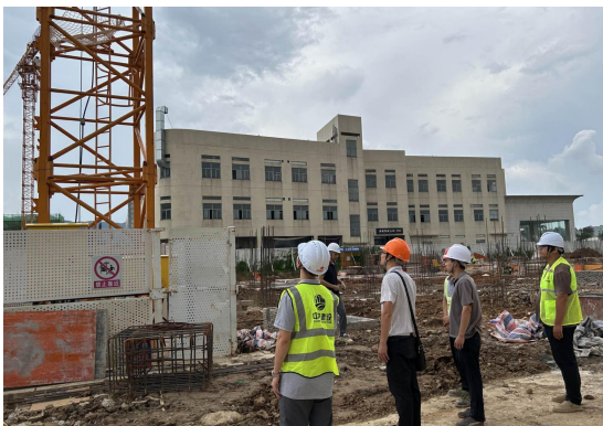
新会区住房和城乡建设局检查“新会区保障性安居工程住宅小区(三期)联和苑项目-1#住宅”

新会区住房和城乡建设局组织对“新会区保障性安居工程住宅小区(三期)联和苑项目-1#住宅”(项目建设单位江门市新会联和公房置业有限公司,施工单位上海宝冶集团有