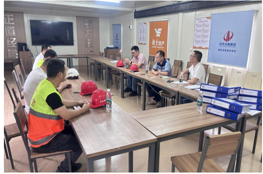
蓬江区住房和城乡建设局检查“星汇观澜花园（A、B地块）建设项目”

蓬江区住房和城乡建设局组织对“星汇观澜花园（A、B地块）建设项目”（项目建设单位江门越盛房地产开发有限公司，施工单位中天华南建设投资集团有限公司，监理单位广州越建工程管理有限公司）开展“两场联动”检查。发现问题有：1.项目管理组织架构相关人员未及时更新。2.派驻项目现场的总监理工程师已变动，但未提供变更资料。3.露天堆放的蒸压加气混凝土砌块未做防雨措施。4.塔式起重机维保记录资料整理不到位，3#、4#塔吊维保资料有误。