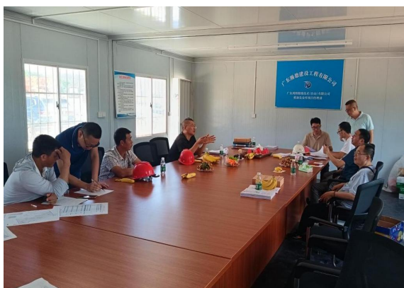
台山市住房和城乡建设局检查“鸿特精密-机加及仓库、熔炼厂房（基础阶段）、联合厂房1~2（基础阶段）”

台山市住房和城乡建设局组织对“鸿特精密-机加及仓库、熔炼厂房（基础阶段）、联合厂房1~2（基础阶段）”（项目建设单位广东鸿特精密技术（台山）有限公司），施工单位广东瀚德建设工程有限公司，监理单位广州广骏工程监理有限公司）开