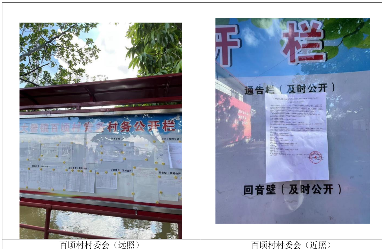
图3-4 征求意见稿现场张贴公示照片