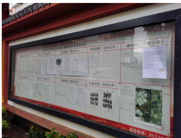
丰盛村村委会（远照）