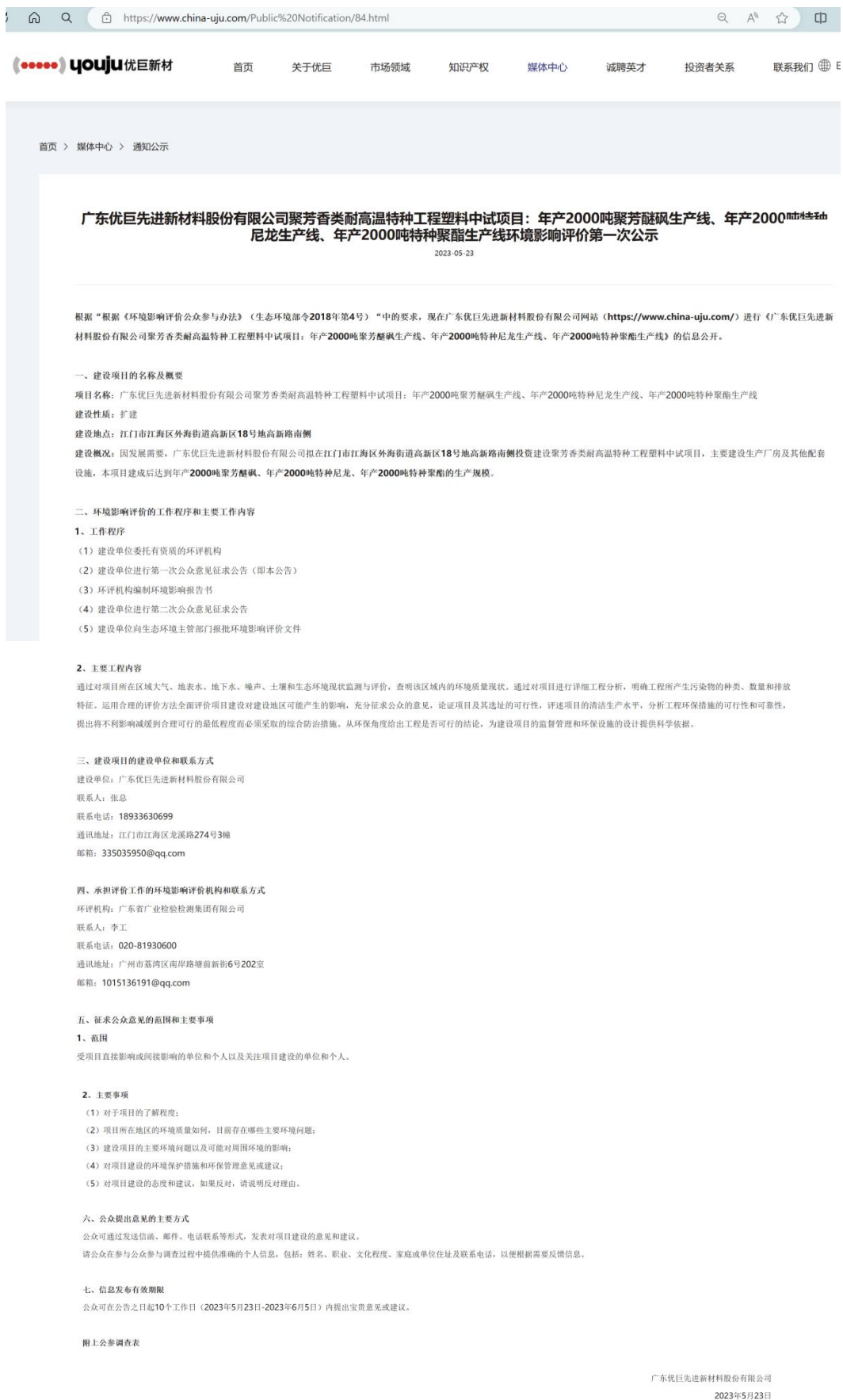
图2-1环境影响评价报告书编制网络公示截图