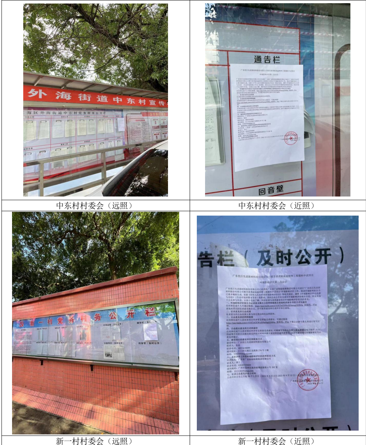
中东村村委会（远照）

本项目环境影响报告书征求意见稿在网络、报纸平台公示的同时，在项目评价范围内敏感点的村委（中东村、新一村、向东村、牛古田村、丰盛村、百顷村）宣传栏等易于知悉的场所张贴公告进行公示，公示时间为10个工作日（2023年9月4日~2023年9月15日），现场公示照片见图3-4。