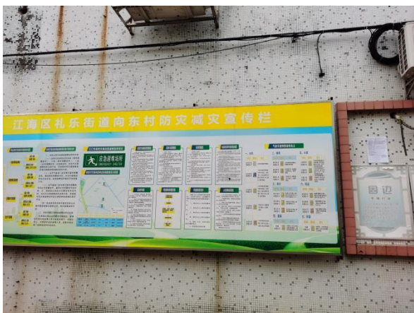
向东村村委会（远照）