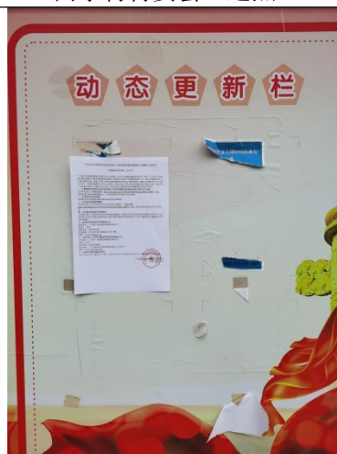
牛古田村村委会（近照）