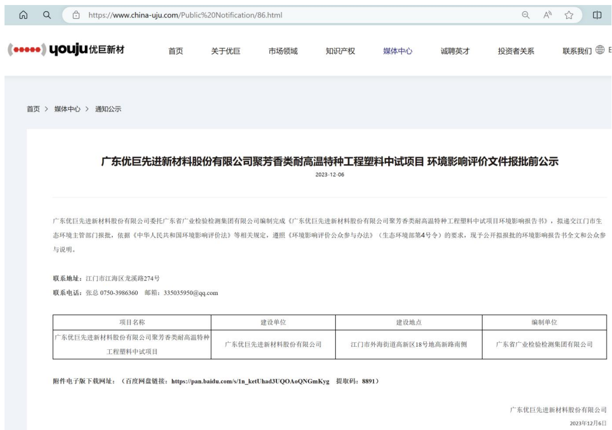
图5-1 报批前公示网上公示信息截图