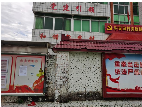
牛古田村村委会（远照）