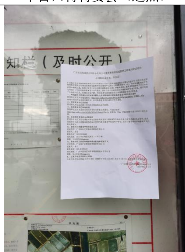
丰盛村村委会（近照）