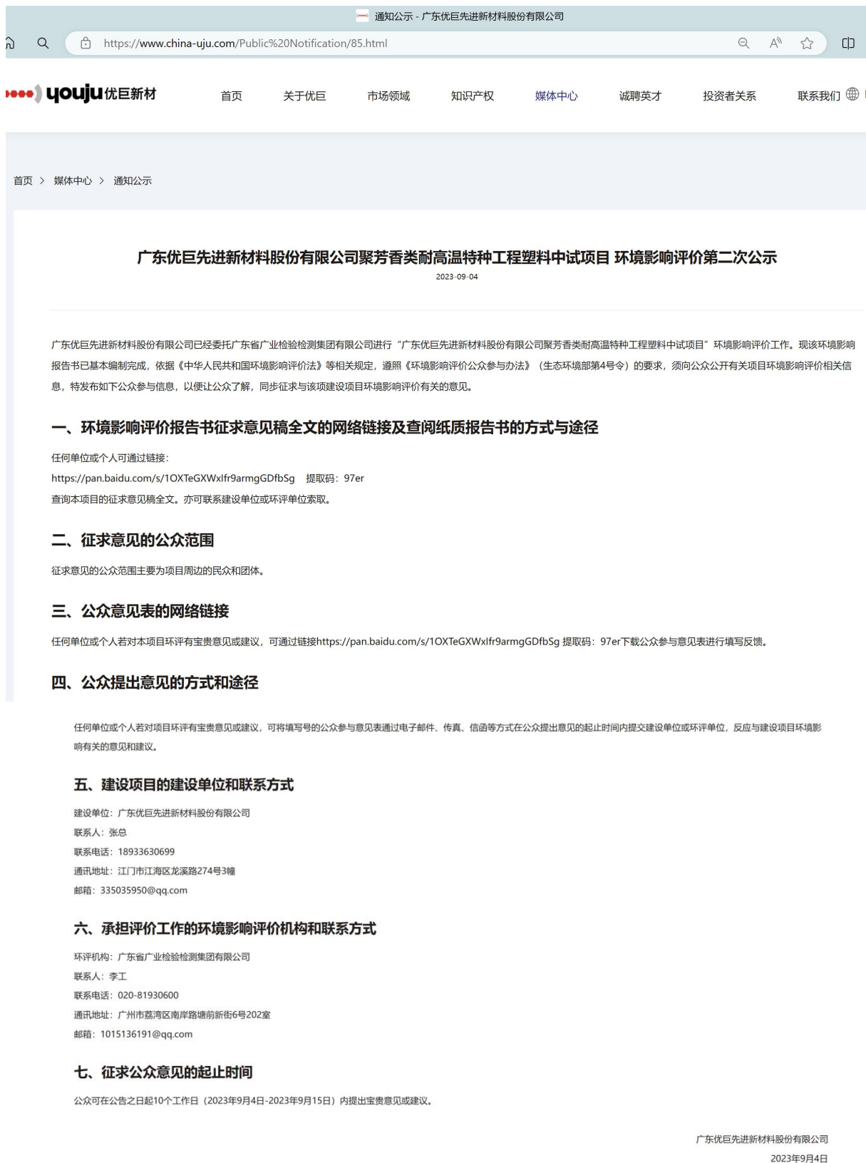
图3-1 征求意见稿网络公示截图