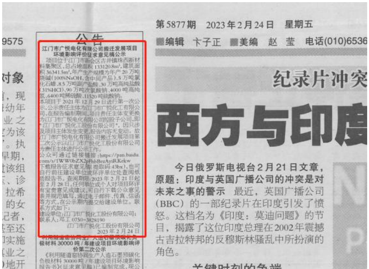
图 3-2 (1) 第二次环保公示报纸公示 (2023 年 2 月 24 日)