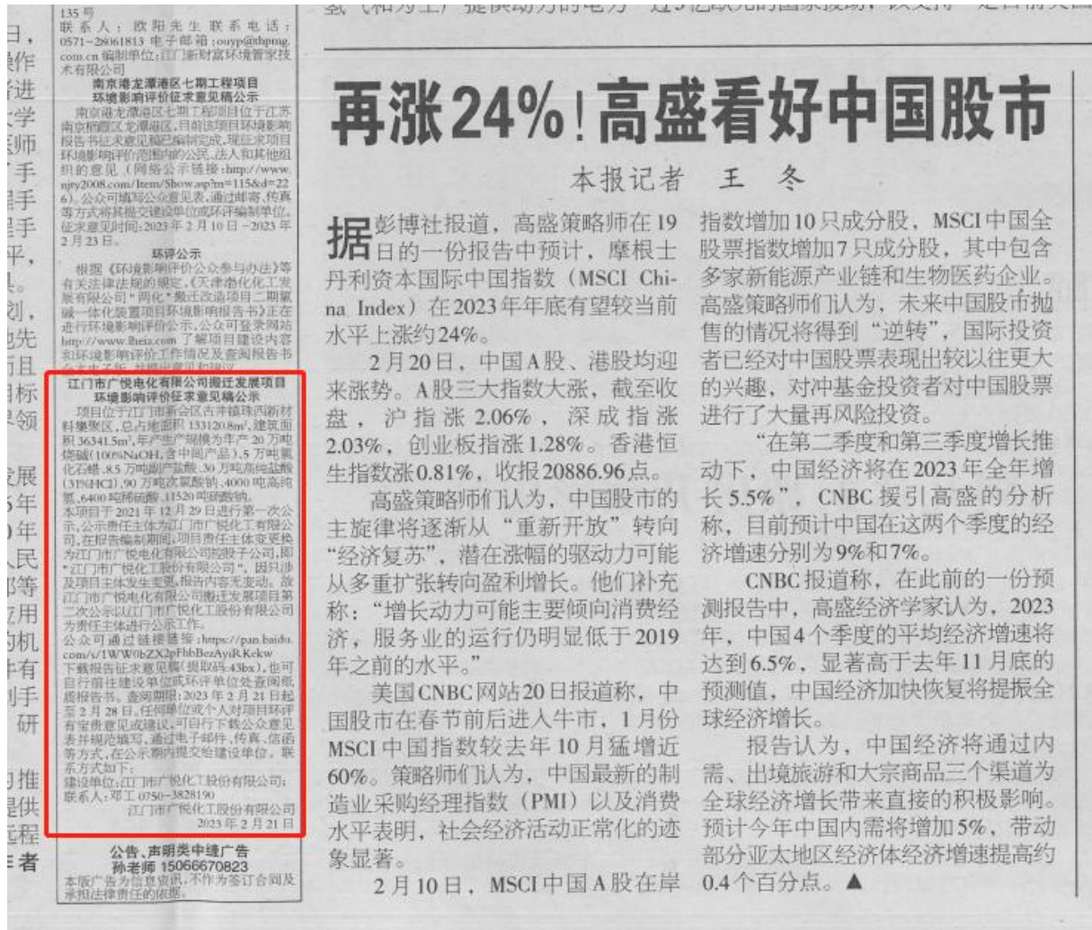
图3-2（1）第二次环保公示报纸公示（2023年2月21日）

第二次环保信息公示在《环球时报》报刊上发布了2次，时间分别为2023年2月21日、2月24日。符合《环境影响评价公众参与暂行办法》要求的第二次环保公示发布2次报纸公示的要求。2次报纸公示的截图见图3-2。