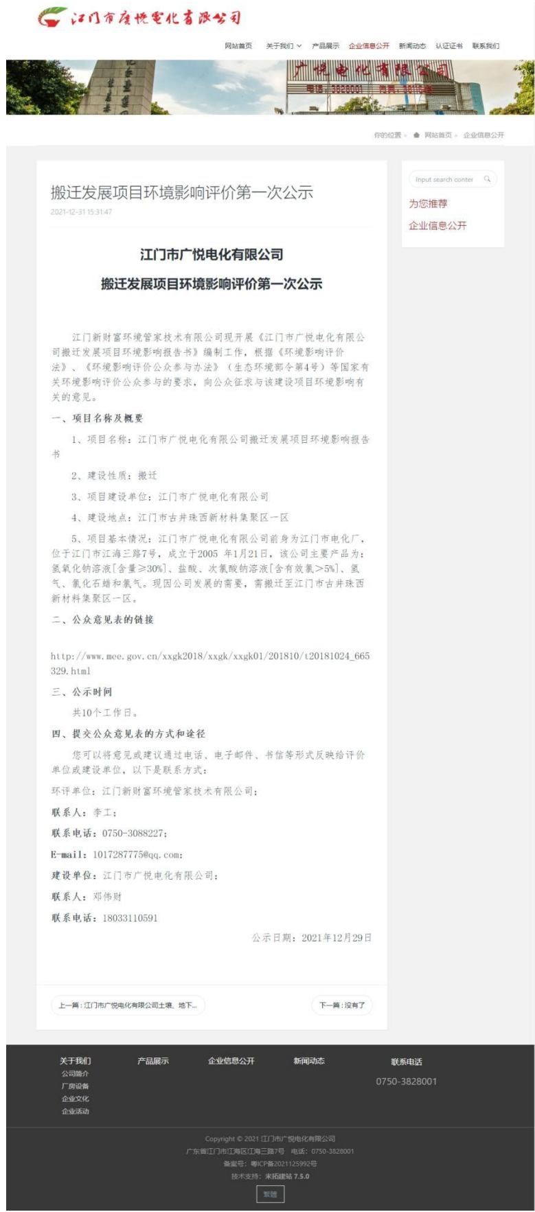
图 2-2 第一次环保公示网络截图