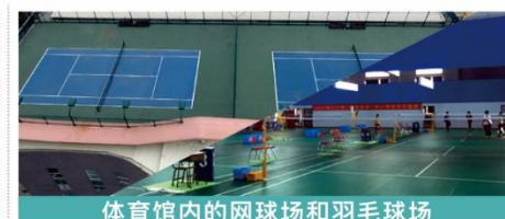
体育馆内的网球场和羽毛球场