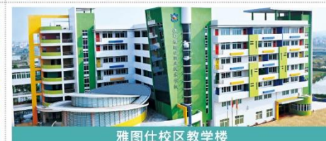
雅图仕校区教学楼