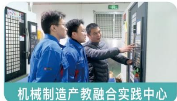
机械制造产教融合实践中心