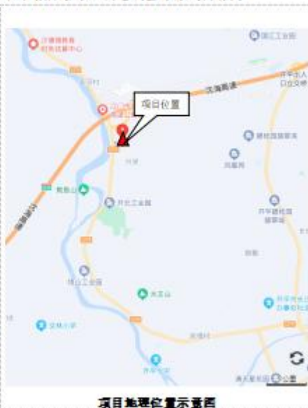
图2.1-1项目第一次公示内容