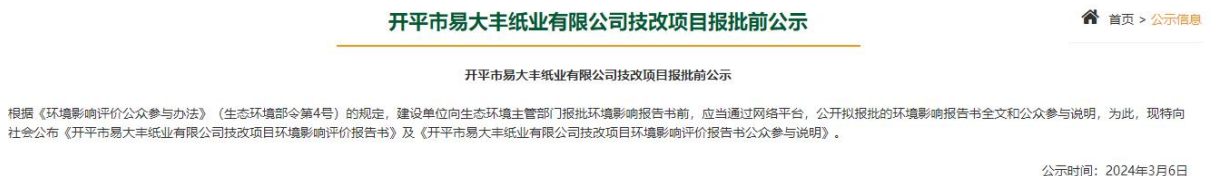
图 3.1-5 项目报批前公示相片

根据《环境影响评价公众参与办法》(生态环境部令第4号)的规定，建设单位向生态环境主管部门报业环境影响报告书前，应当通过网络平台，公开拟报批的环境影响报告书全文和公众参与说明。我单位于2024年3月6日在环评单位网站进行进行了报批前公示，公示照片见图3.1-5。