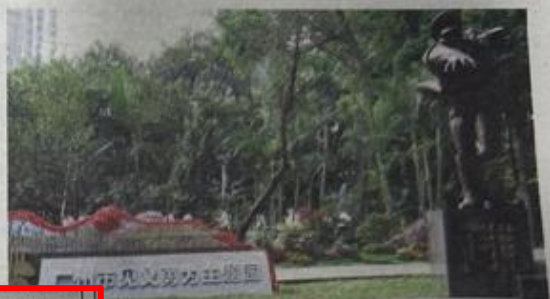
广州市首个见义勇为主题园落成。