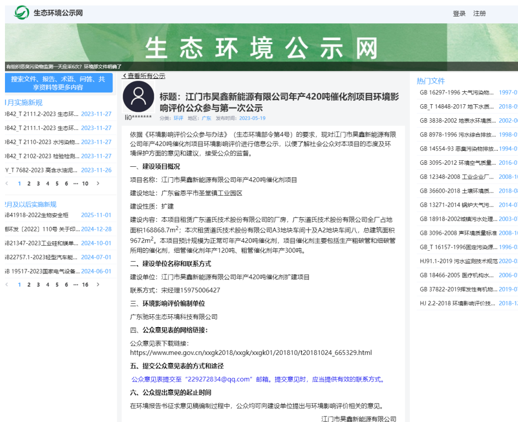
图 1 第一次公示网络截图

本次公开采用网络公开方式，本公司于 2023 年 5 月 19 日在生态环境公示网对“江门市昊鑫新能源有限公司年产 420 吨催化剂项目”环境影响评价工作进行了第一次公示。公示网址为“ https://gongshi.qsyhbgi.com/h5public-detail?id=338071 ”，截图见下图 1。