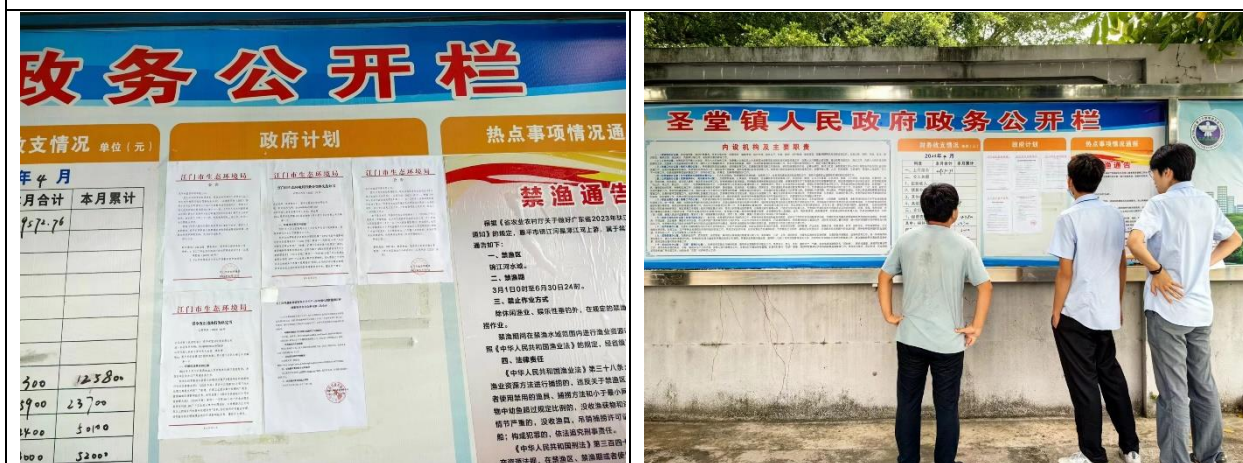
圣堂镇人民政府公开栏