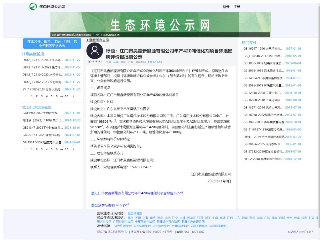
图5 报批前公众参与网络公示截图

本次公开采用网络公开方式，公开载体为“生态环境公示网”，符合《环境影响评价公众参与办法》要求。公开时间为2022年11月9日，网址为“https://gongshi.qsyhbgj.com/h5public-detail?id=363501”，截图见图5。