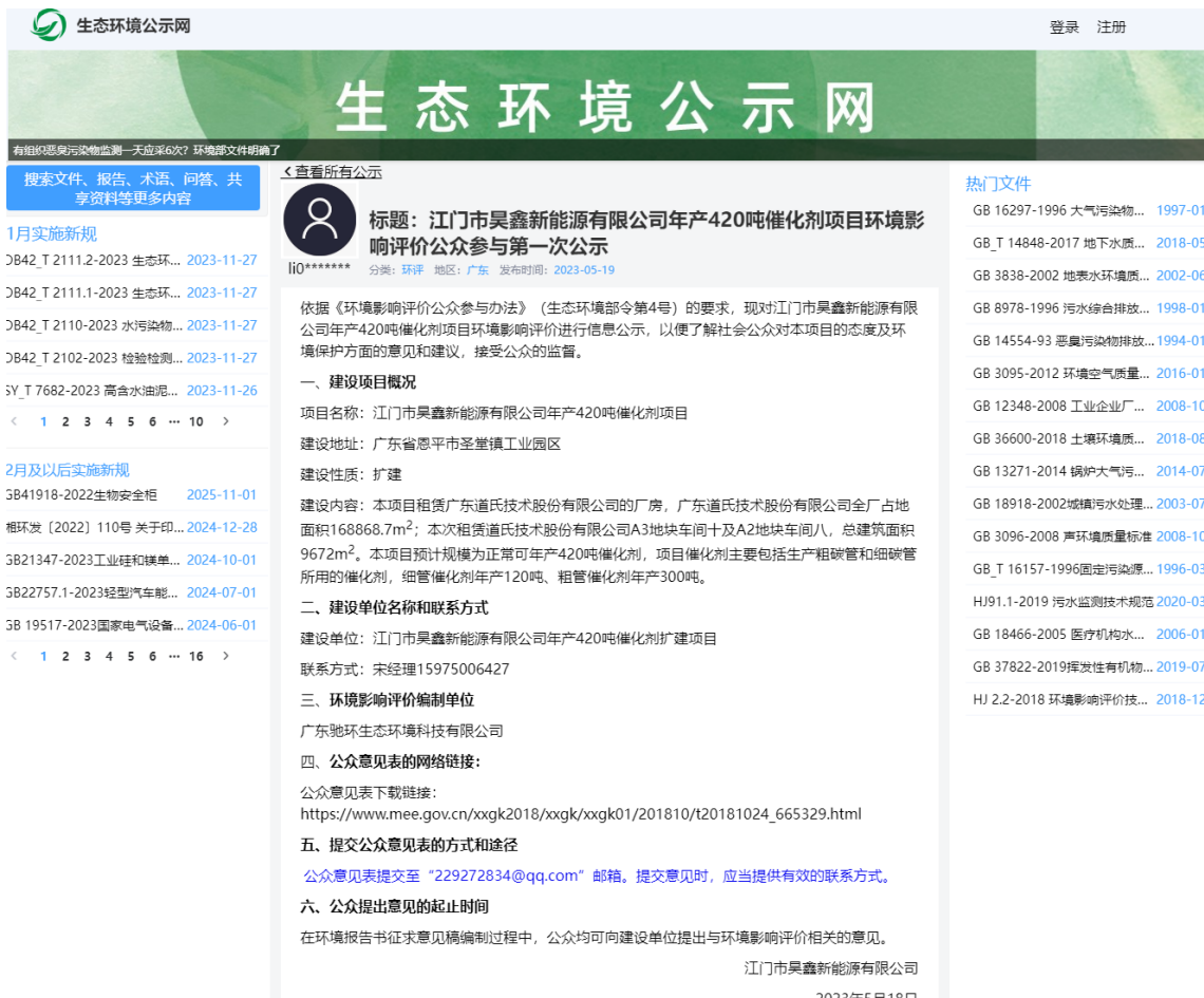
图 2 第二次公示网络截图