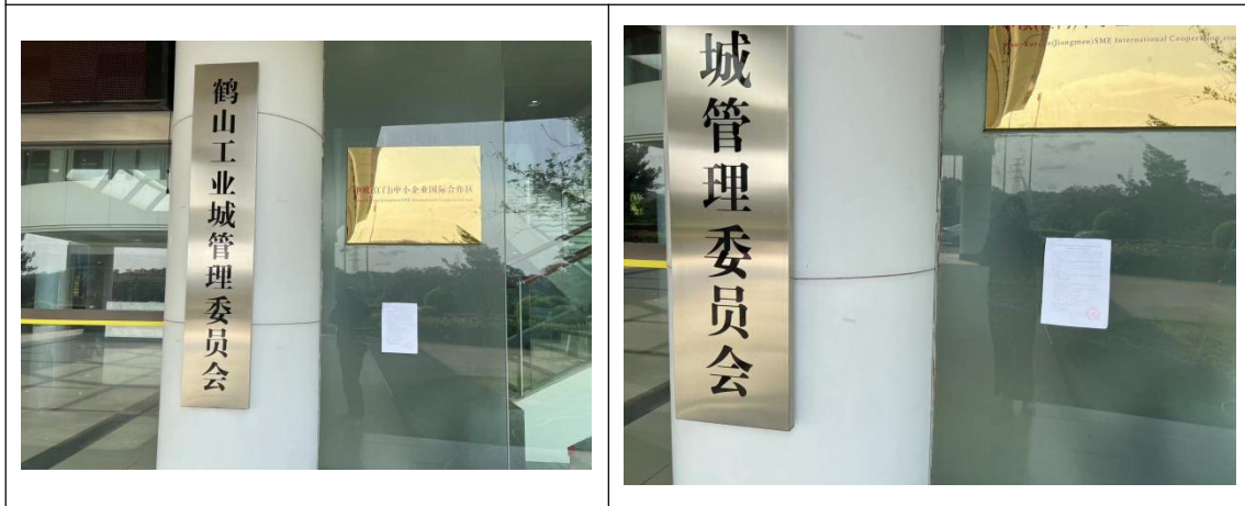
鹤山工业城管理委员会