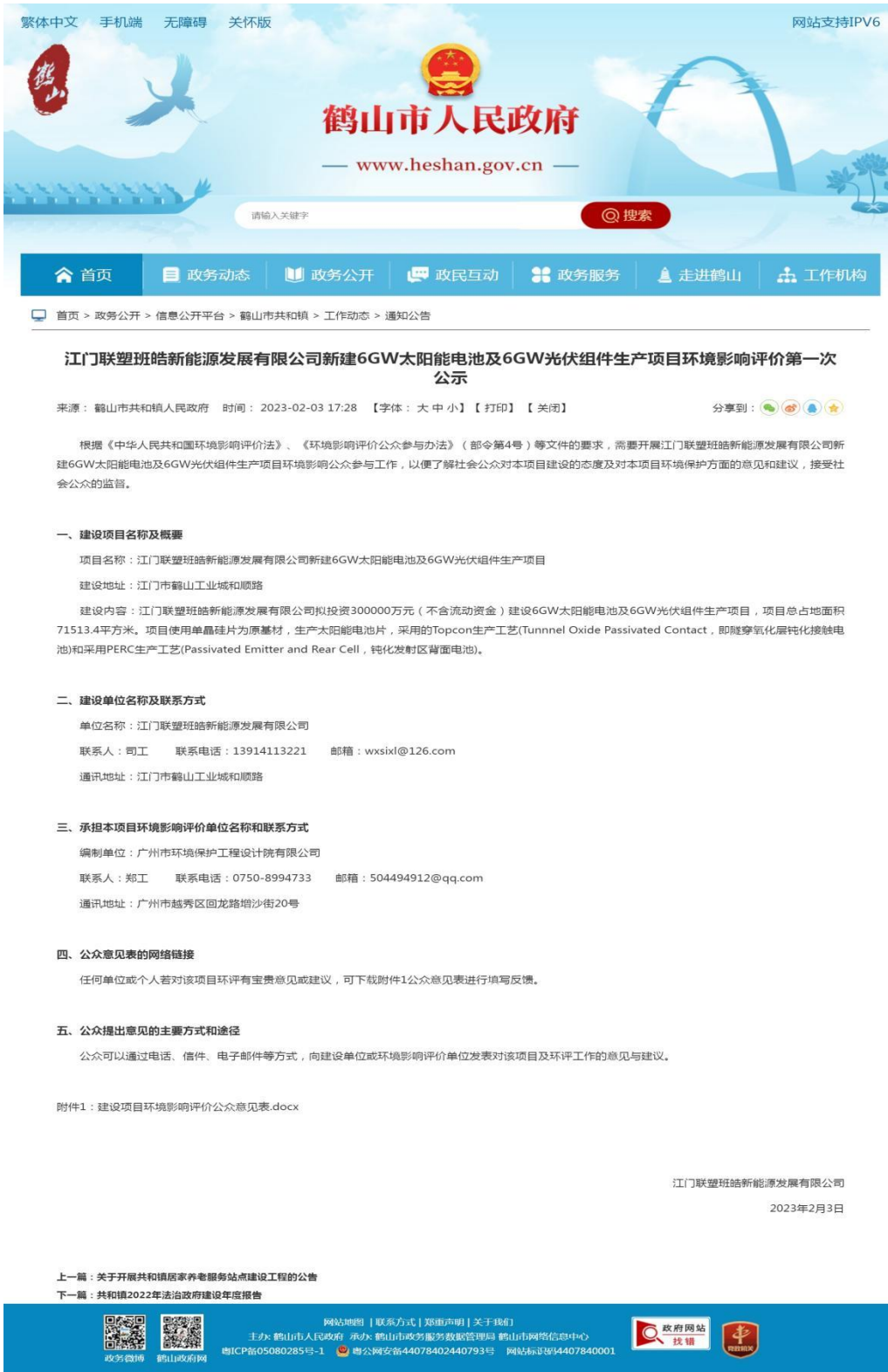
图2-1 第一次环境影响评价信息公开网络公示截图