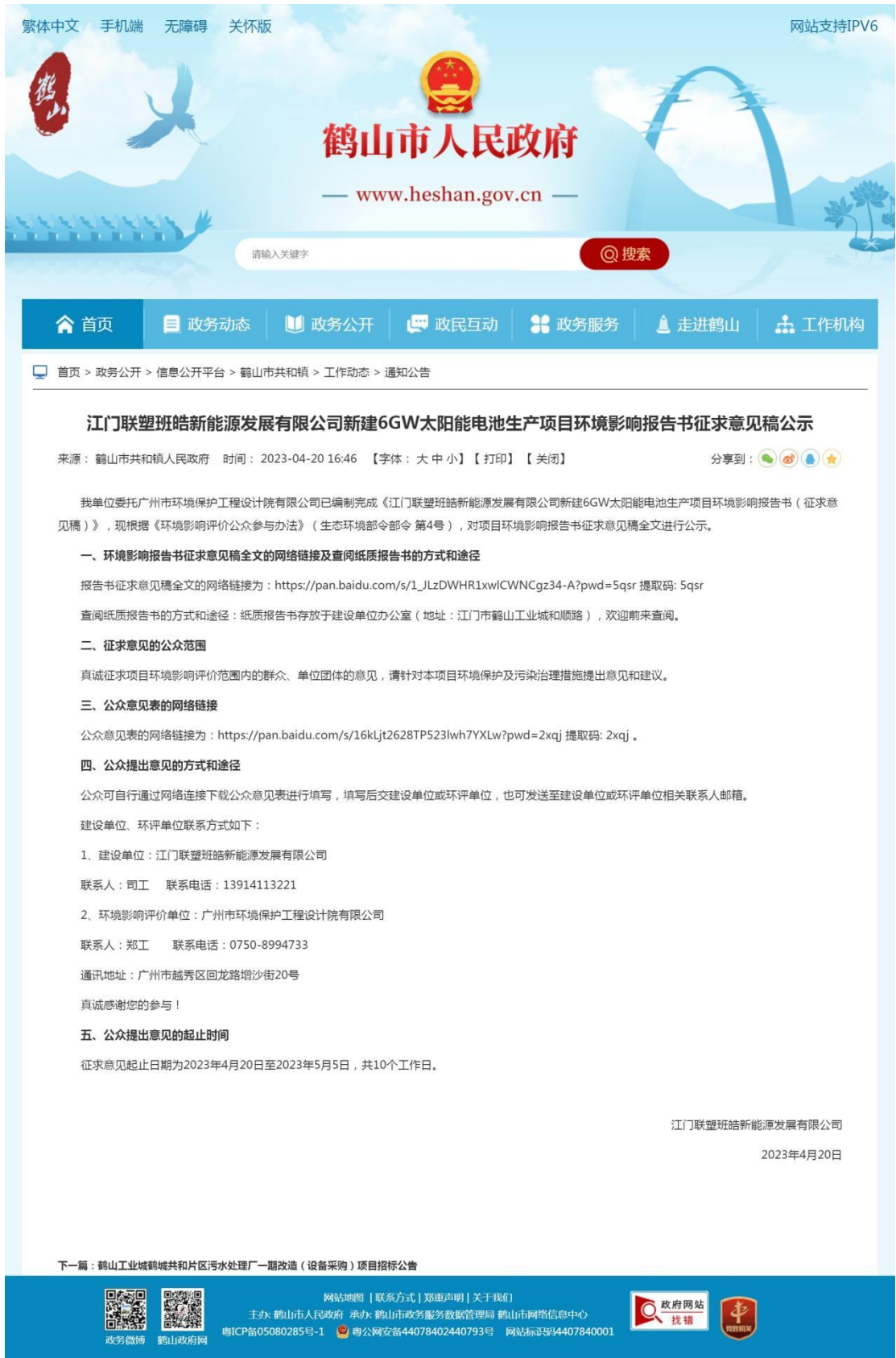
图 3-1 征求意见稿网上公示截图