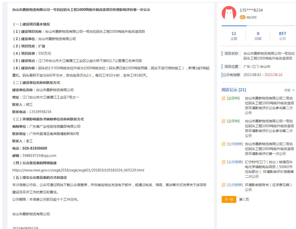
图 2-1 第一次网上公示截图