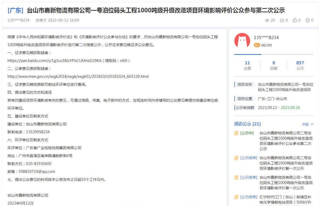
图 3-1 第二次网上公示截图