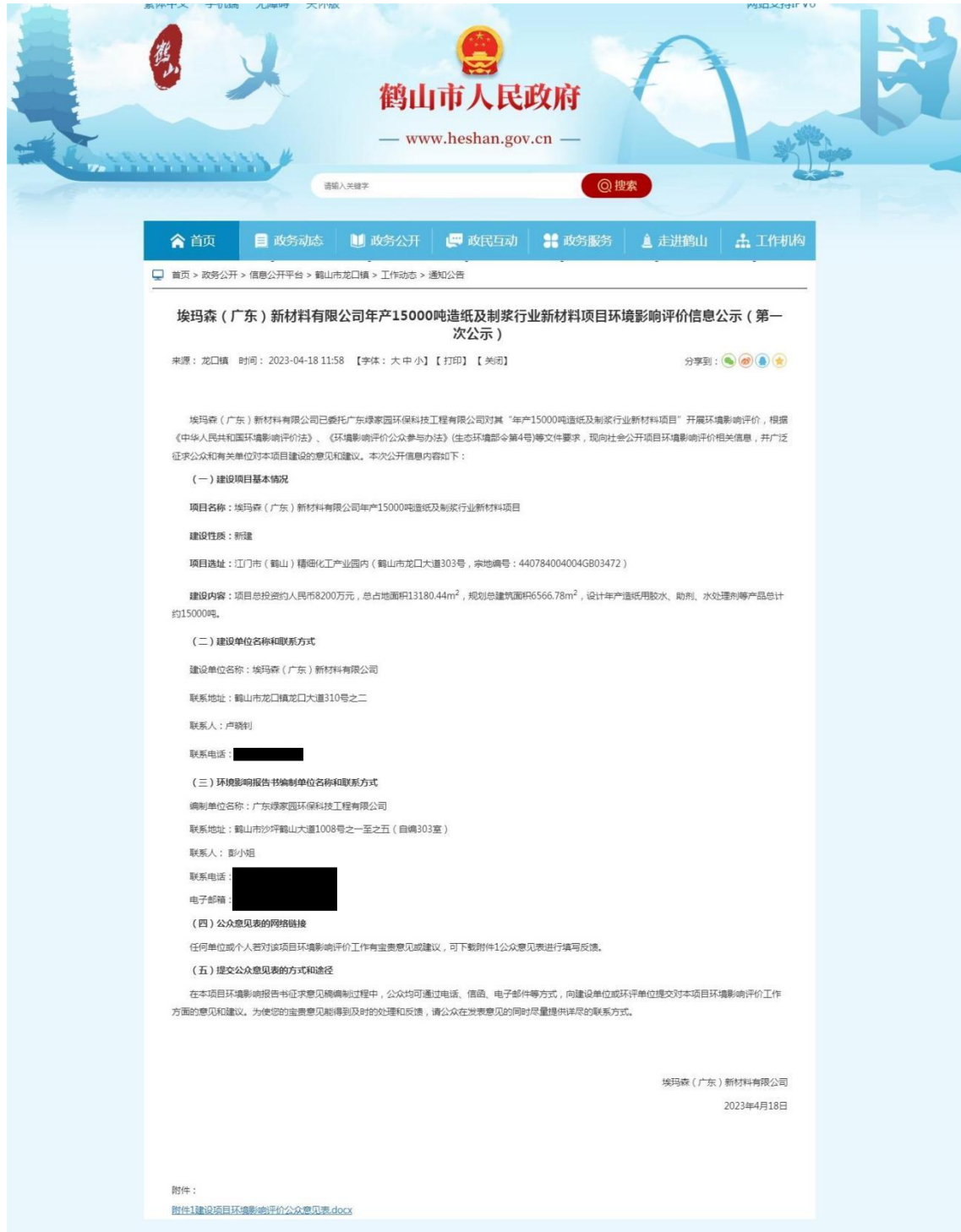
图 2.1-1 环境影响评价报告书编制网络公示截图