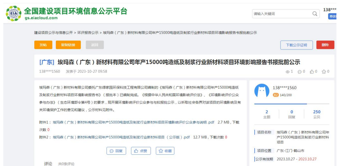
图 6.2-1 报送前公示截图

载体选取符合性分析：本项目位于鹤山市龙口大道 303 号。本项目报批前公开方式采用网络平台，于 2023 年 10 月 27 日网上公开拟报批的环境影响报告书全文和公众参与说明。因此，本项目报批前公开载体的选取符合《环境影响评价公众参与办法》要求。