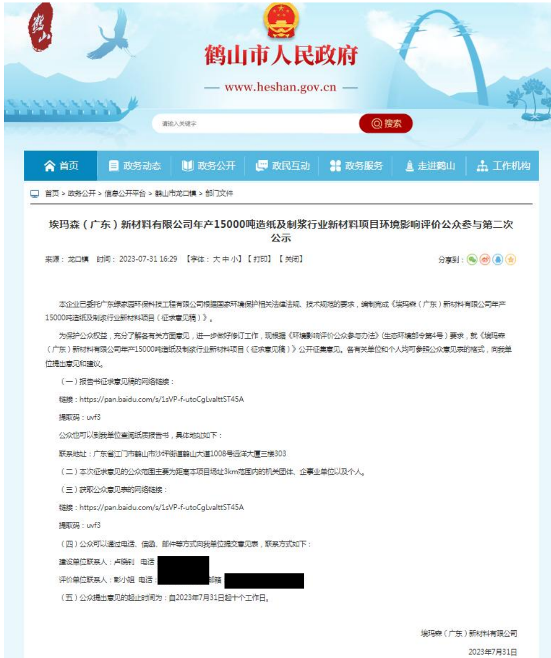
图 3.2-1 征求意见稿网络公示截图