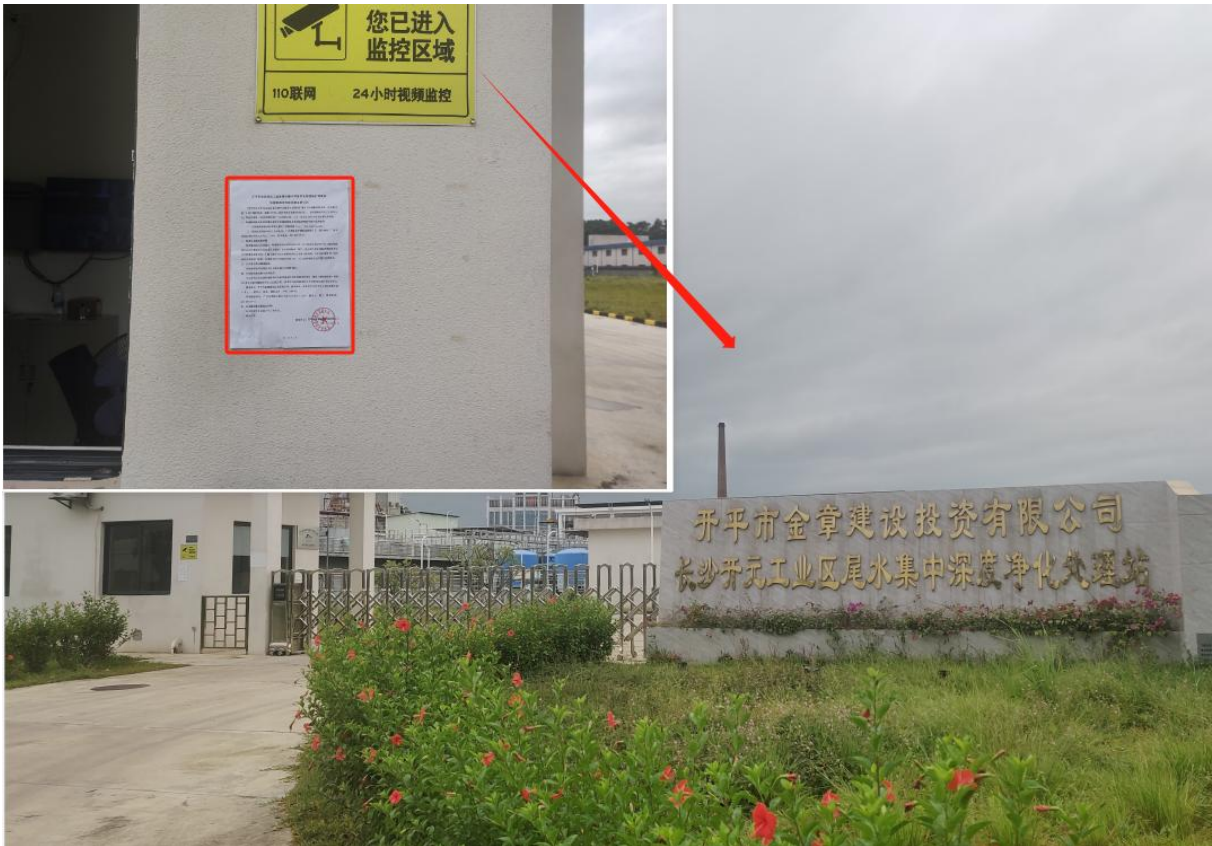
开元工业区金章净化处理站门口