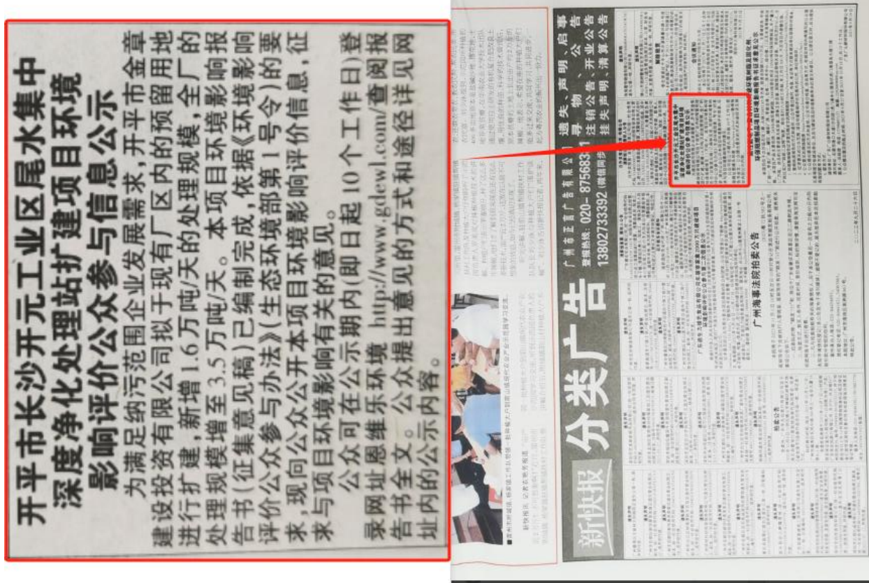
图3 报纸第一次公示照片（2023年9月29日）