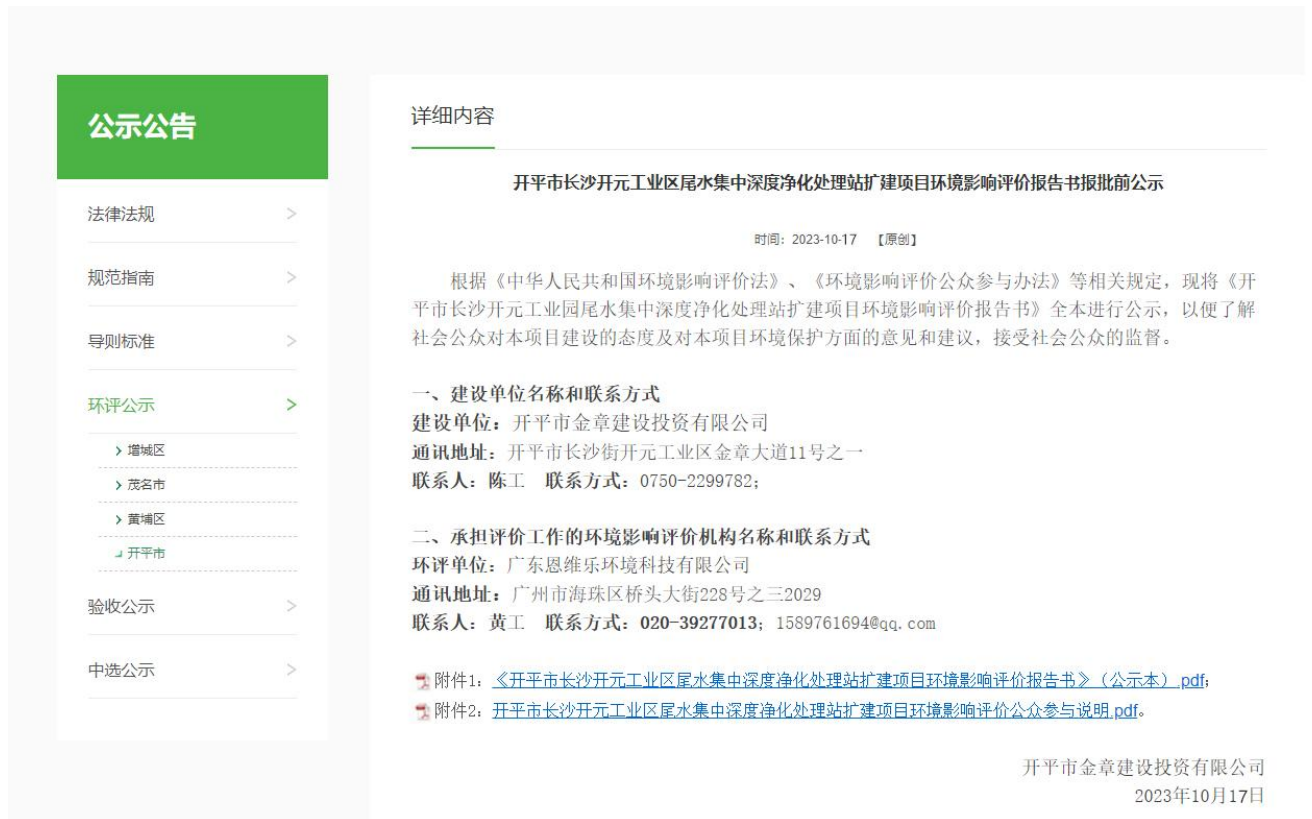
图 6 报批前公示截图（2023 年 10 月 17 日）