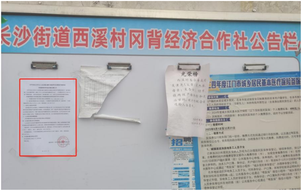
长沙街道西溪村网背经济合作社公告栏