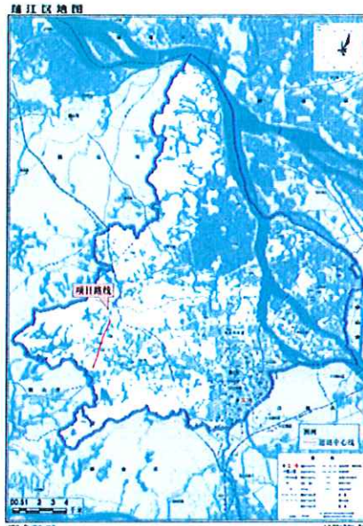
项目地理位置示意图

建设单位(盖章)：江门市蓬江区政府投资工程建设管理中心 2022 年 10 月 10 日