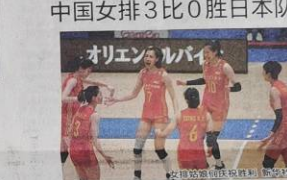
中国女排队员庆祝胜利