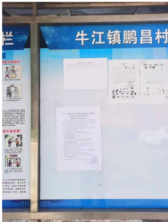
鹏昌村张贴现场公示（近照）