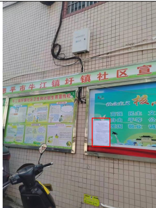
牛江镇圩镇张贴现场公示（远照）