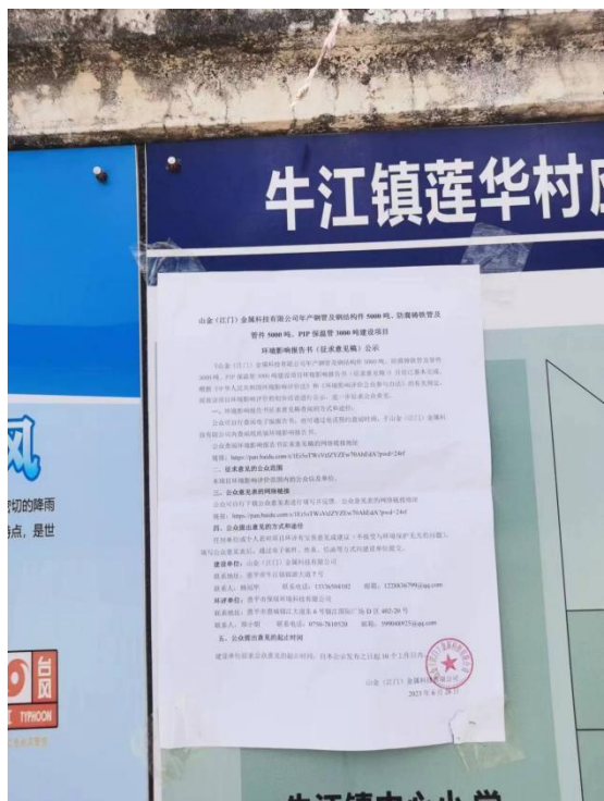
莲华村张贴现场公示（近照）