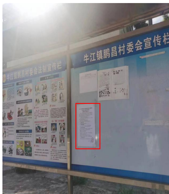
鹏昌村张贴现场公示（远照）