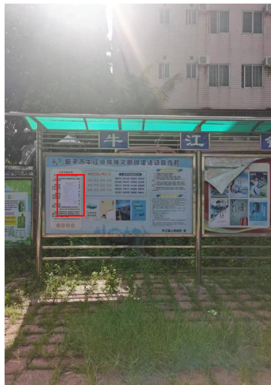
牛江镇服务中心张贴现场公示（远照）