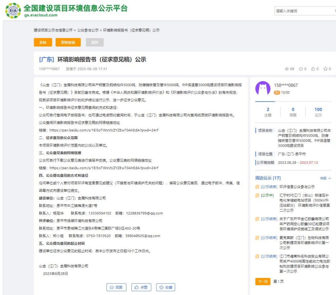
图 4.2-1 征求意见稿环境影响评价信息公开截图（全国建设项目环境信息公开平台官网官网）