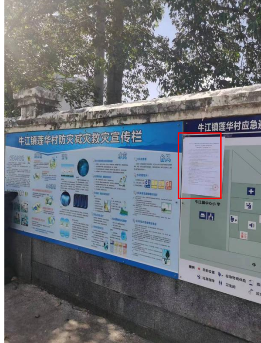
莲华村张贴现场公示（远照）