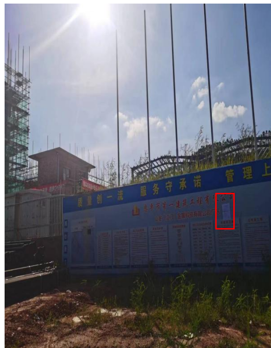
山金（江门）金属科技有限公司张贴现场公示（近照）