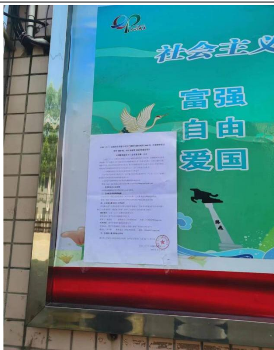
牛江镇圩镇张贴现场公示（近照）