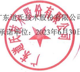
图10-1企业诚信承诺函