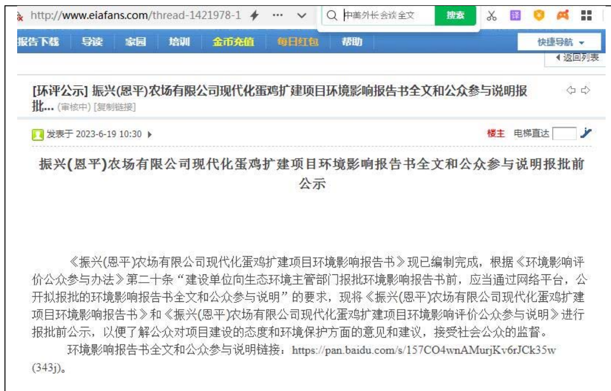
图 6.1-1 网络公示截图

《振兴(恩平)农场有限公司现代化蛋鸡扩建项目环境影响报告书》和《振兴(恩平)农场有限公司现代化蛋鸡扩建项目环境影响评价公众参与说明》，网址： http://www.eiafans.com/thread-1421978-1-1.html 。