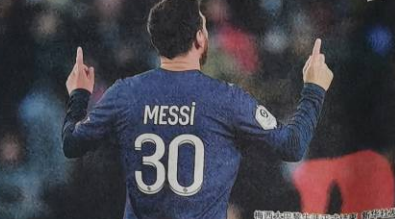
梅西这两年收获颇丰