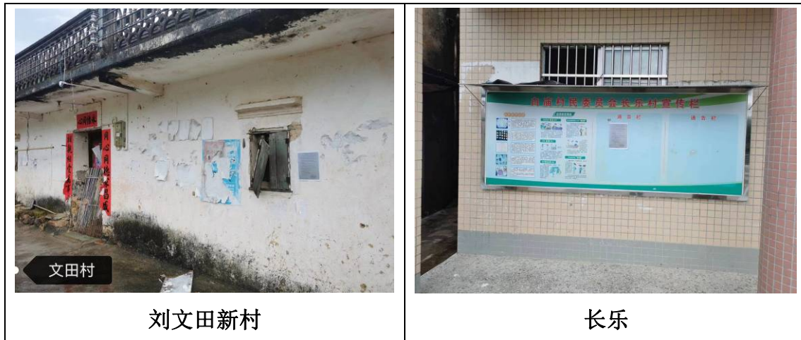
图 3.2-3 现场张贴公示