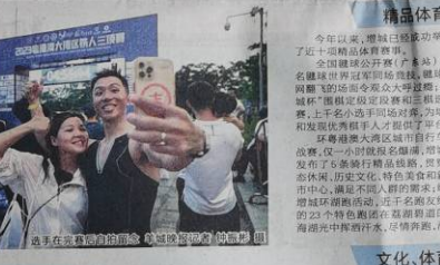
选手在赛道上奋力拼搏

2023年粤港澳大湾区铁人三项赛在广州增城圆满落幕。本次比赛吸引了众多国内外选手参加，赛事组织严密，服务水平高，充分展现了增城作为粤港澳大湾区重要节点城市的体育实力和城市魅力。 本次比赛在增城举行，吸引了众多国内外选手参加。赛事组织严密，服务水平高，充分展现了增城作为粤港澳大湾区重要节点城市的体育实力和城市魅力。