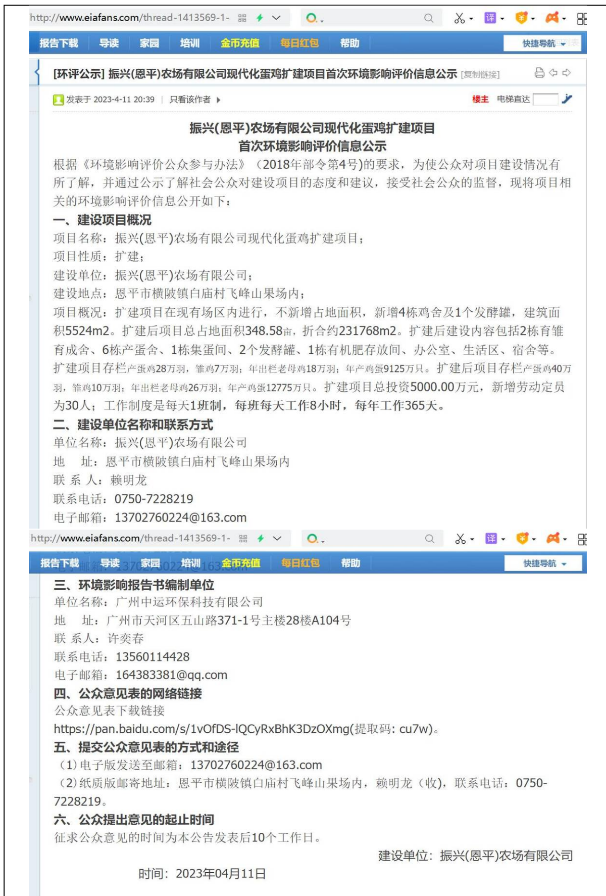
图 2.2-1 首次环评信息公示截图