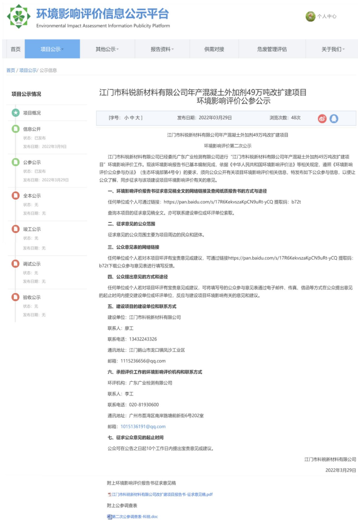
图3-1 征求意见稿网络公示截图