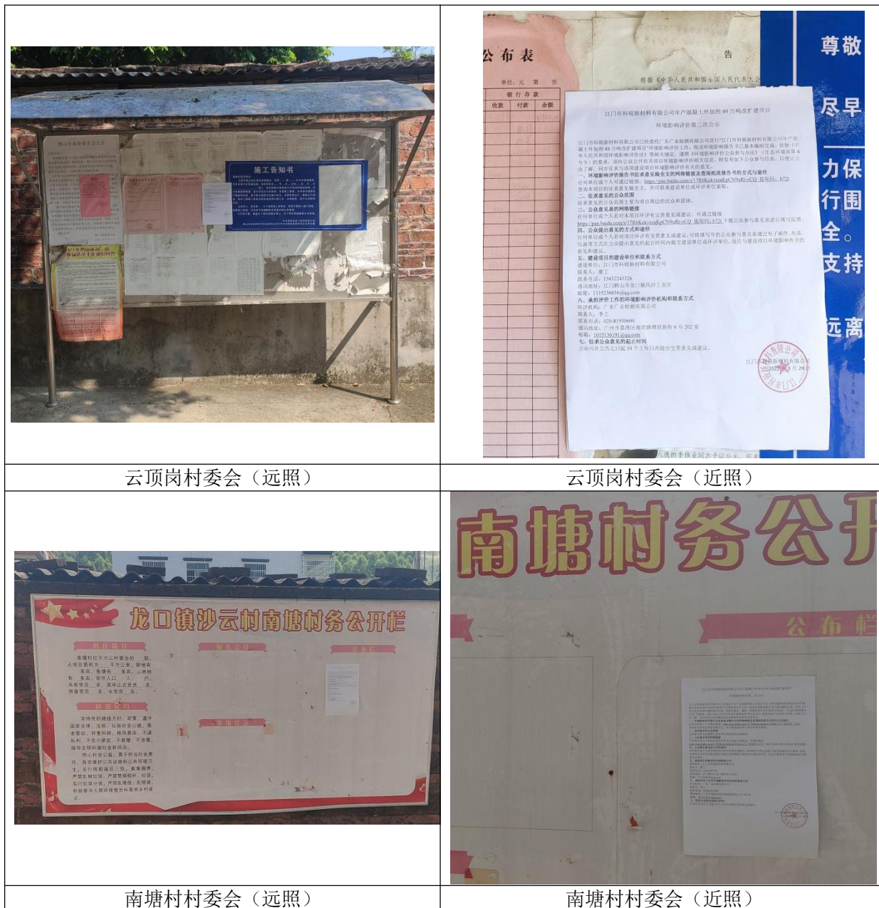
云顶岗村委会（远照）

本项目环境影响报告书征求意见稿在网络、报纸平台公示的同时，在项目评价范围内敏感点的村委宣传栏等易于知悉的场所张贴公告进行公示，公示时间为10个工作日（2022年3月29日~2022年4月12日），现场公示照片见图3-4。