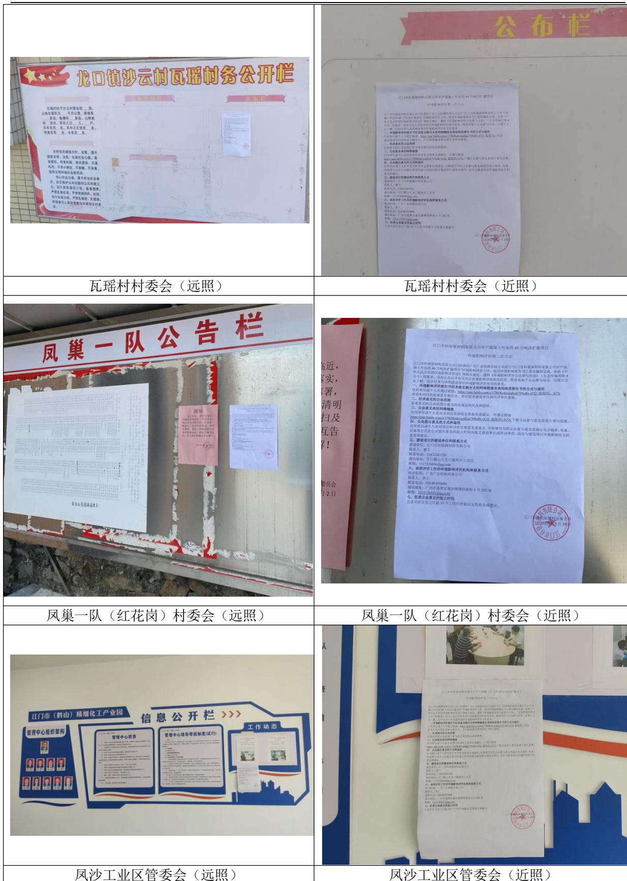
瓦瑶村村委会（远照）