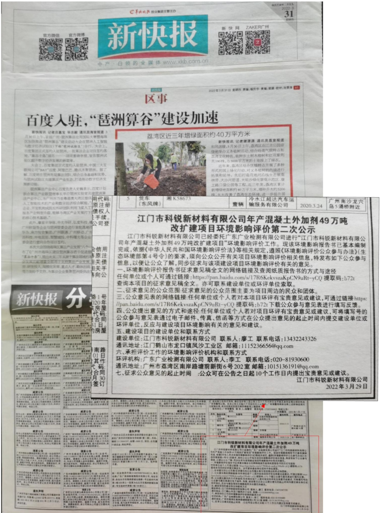
图3-2 第一次报纸公示内容