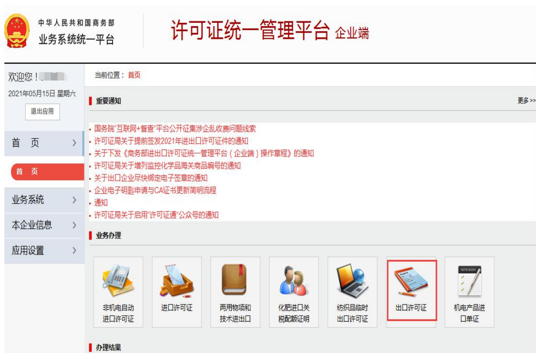
图 1.4 选择出口许可证