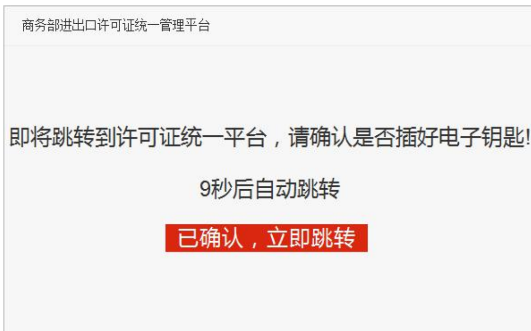
图 1.3 CA 电子钥匙提示