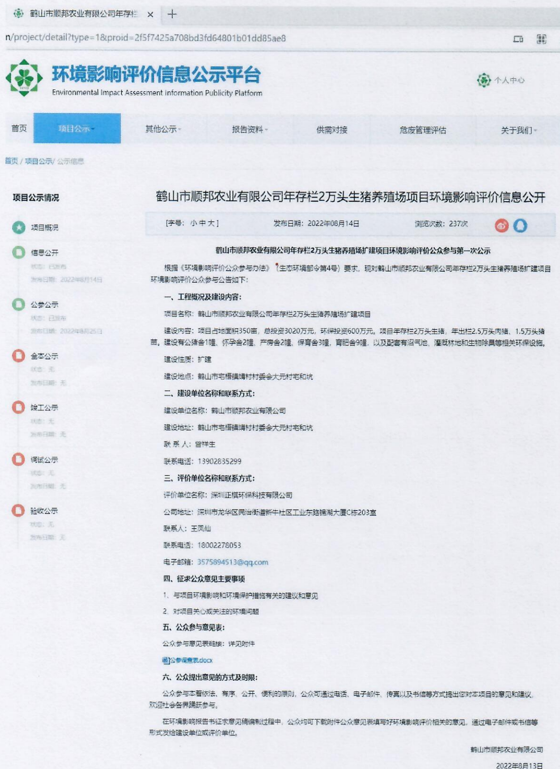
图 2-1 第一次网上公示网页截图