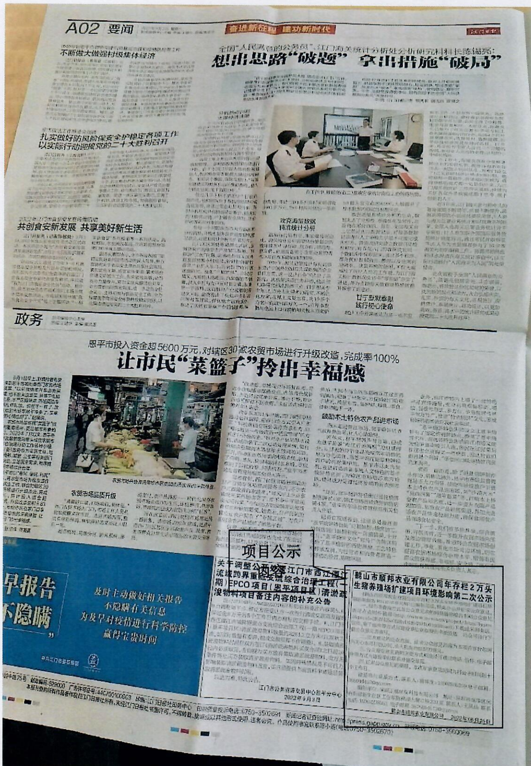
图 3-5 江门日报 9月3日截图。