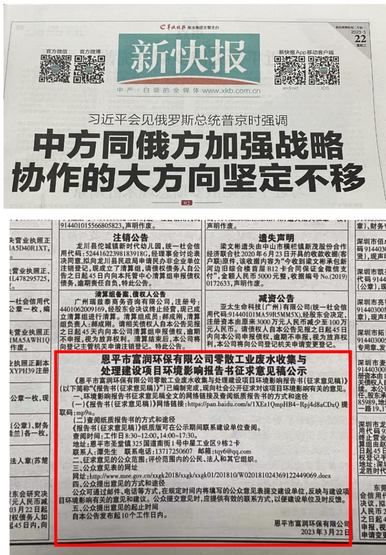
图6-2 2023年3月22日首次报纸公示截图

本项目于2023年3月22日及2023年3月23日在《新快报》进行了环评信息公告。《新快报》为项目所在地发行范围较广的域内报纸媒体，属于项目所在地公众易于接触的报纸，选取该报纸符合《环境影响评价公众参与办法》的要求。