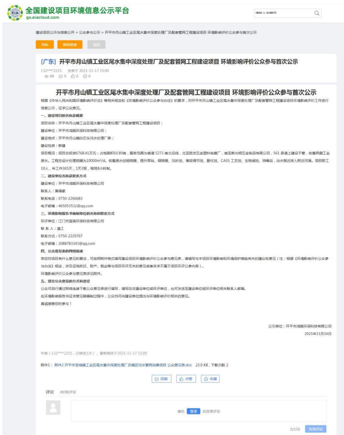
图 2-1 首次环境影响评价信息公开网络公示截图