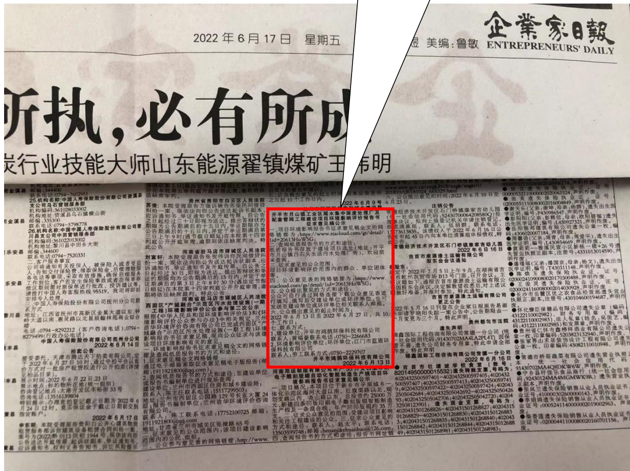
图 3-2 征求意见稿公示第一次报纸公示信息