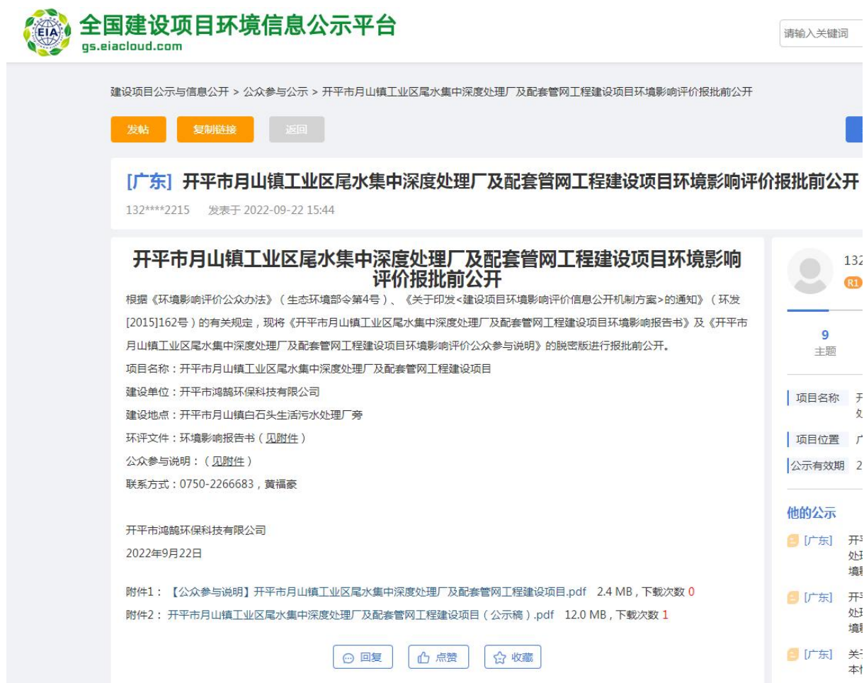
图 6-1 报批前网络公开截图

载体选取的符合性分析：本项目报批前公开方式采用建设项目所在地且公众易于接触的环评爱好者网，于 2022 年 9 月 22 日网上公开拟报批的环境影响报告书全文和公众参与说明。因此本项目报批前公开载体的选取符合《环境影响评价公众参与办法》要求。