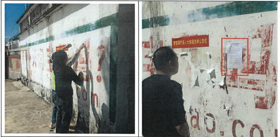
堡城村宣传栏公示照片