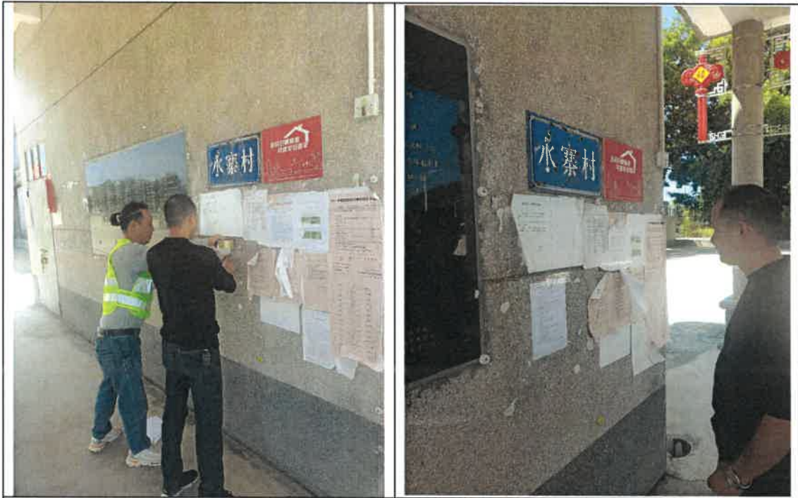
水寨村宣传栏公示照片