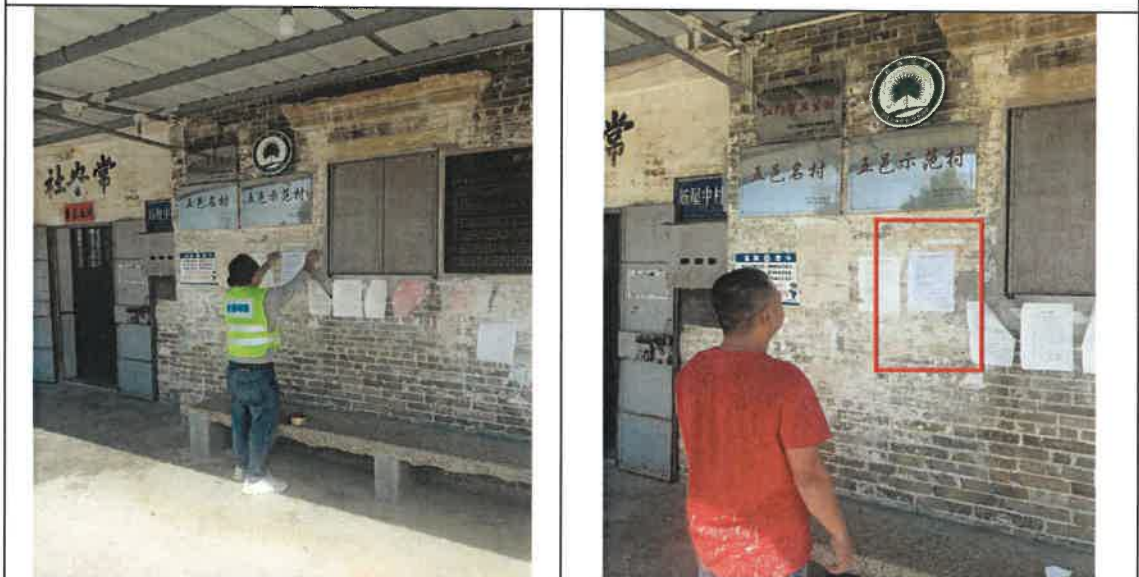
新屋村宣传栏公示照片