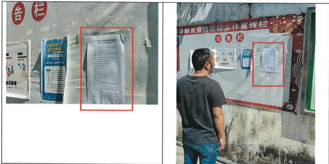
平安村宣传栏公示照片