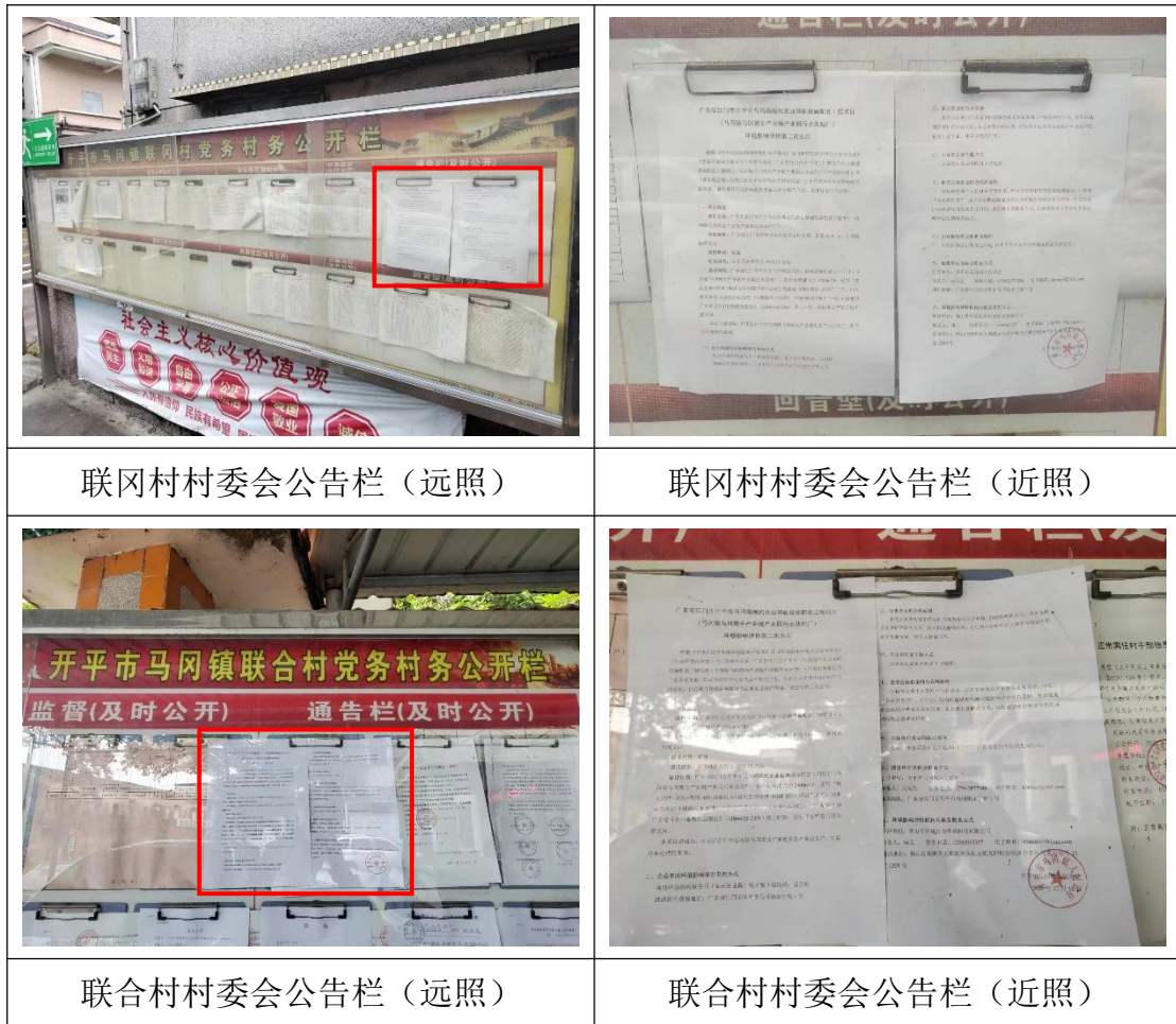
图 3-4 征求意见稿公示现场张贴照片