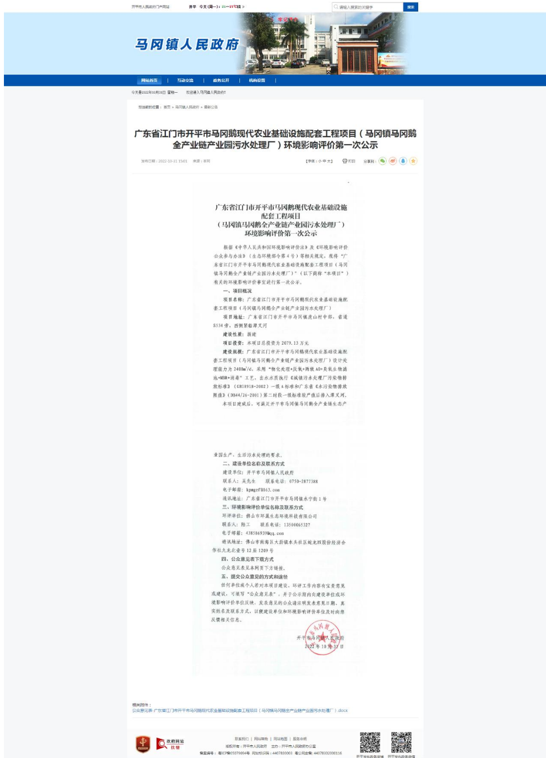
图 2-1 首次环境影响评价信息网上公开截图