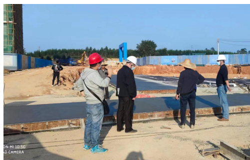
开平市住房和城乡建设局检查“江门市国家小微双创龙胜配示范基地规划路（三期）”

开平市住房和城乡建设局对“江门市国家小微双创龙胜配示范基地规划路（三期）”开展“两场联动”检查。检查过程中，主要管理人员到位。存在问题有：1.无施工合同资料。2.工人工资资料不齐全。3.勘察设计资料不齐全。4.未架空电箱