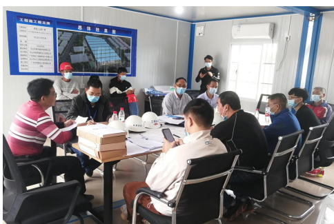
台山市住房和城乡建设局检查“中山市鼎至盛控股有限公司鼎盛工业园一期工程”

台山市住房和城乡建设局对“中山市鼎至盛控股有限公司鼎盛工业园一期工程”开展“两场联动”检查。检查过程中，主要管理人员到位。存在问题有：1.未独立