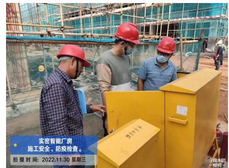
恩平市住房和城乡建设局检查 “广东实密智能装备有限公司 1# 厂房、2#厂房、办公楼、门卫”

恩平市住房和城乡建设局对“广东实密智能装备有限公司 1#厂房、2#厂房、办公楼、门卫”开展“两场联动”检查。检查过程中，主要管理人员到位。发现问题有：1.塔吊底部围蔽不符合要求。2.塔吊开关箱漏电保护开关额定动作电流大于30mA 不符合要求（现场 150mA），未固定