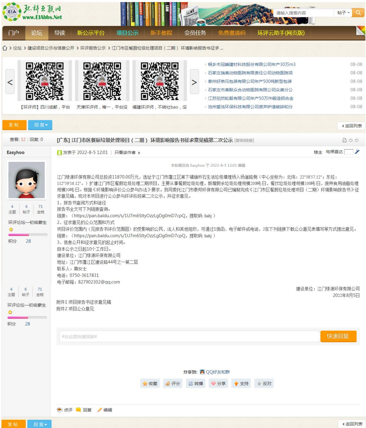
图 3-2 第二次网站公示截图（一）