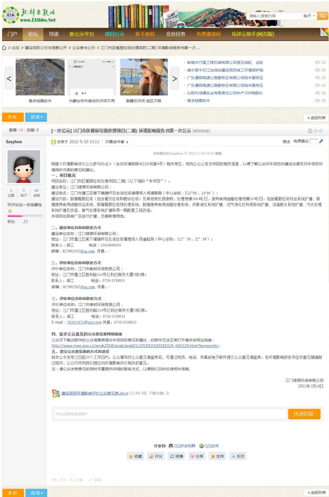
图 3-1 第一次网站公示截图