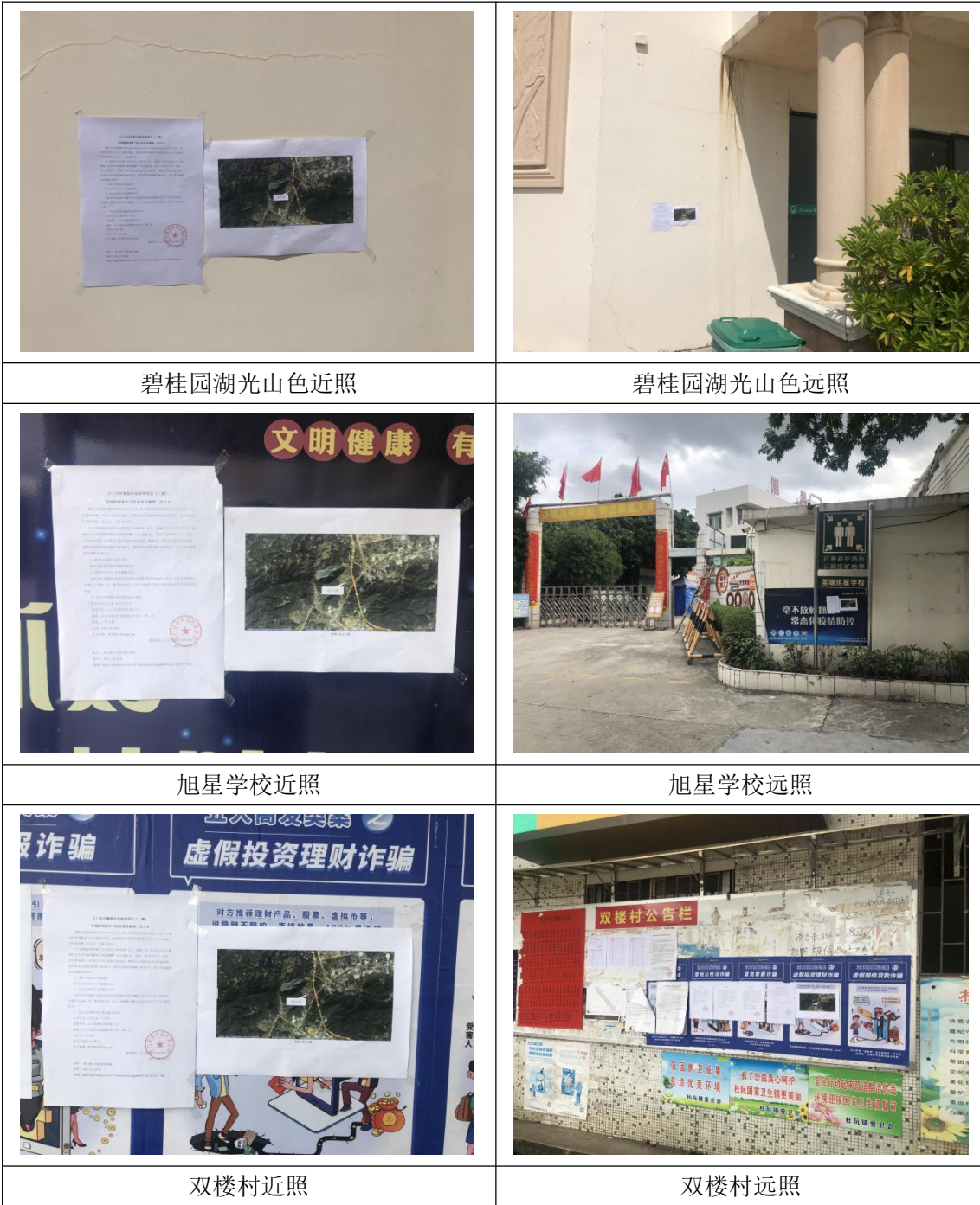
图 3-3 第二次张贴公示照片（二）