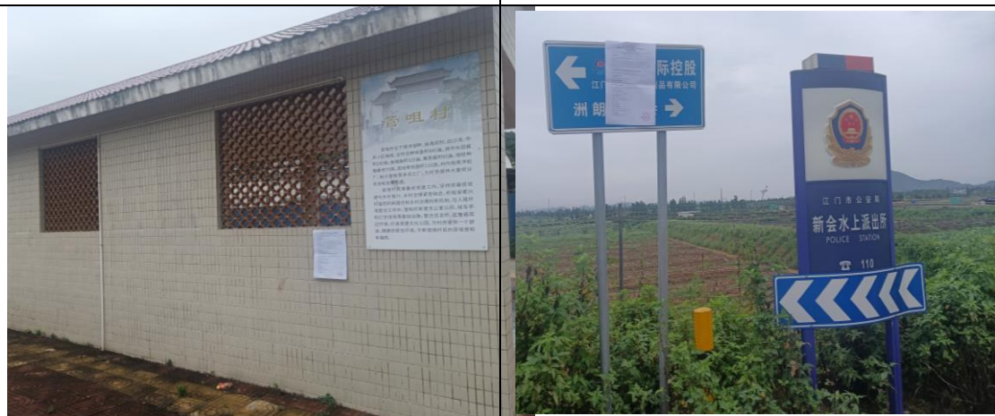
管咀村现场张贴照片