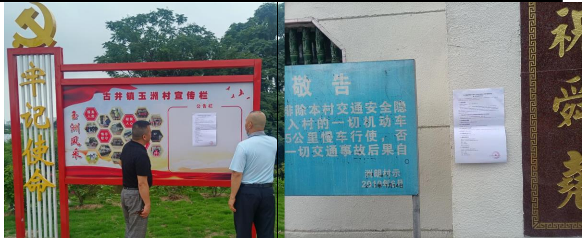
玉洲村张贴现场照片

张贴起始时间为2022年5月26日-2022年6月10日，共10个工作日，符合《环境影响评价公众参与办法》第十一条“持续公开期限不得少于10个工作日”的要求。公示的照片以及全文见图3.2-3。