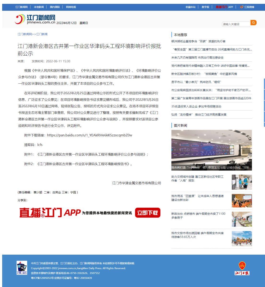
图 6.2-1 报批前网络公示截图

江门新闻网是建设项目所在地公共媒体网络平台，载体的选择符合《环境影响评价公众参与办法》第二十条“建设单位向生态环境主管部门报批环境影响报告书前，应当通过网络平台，公开拟报批的环境影响报告书全文和公众参与说明。”的要求。公示的截屏图片见图 6.2-1。