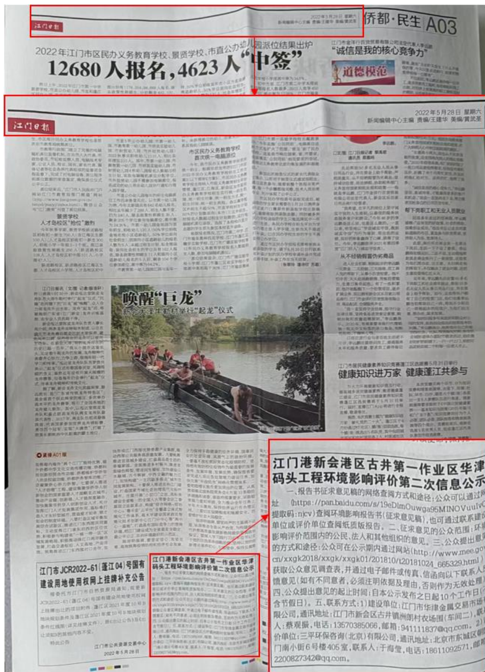
图 3.2-2a 征求意见稿第一次报纸公示

按照《环境影响评价公众参与办法》的要求，本项目在江门日报进行了征求意见稿报纸公示，江门日报是建设项目所在地公众易于接触的报纸，载体的选择符合《环境影响评价公众参与办法》要求。两次报纸公示时间分别为 2022 年 5 月 28 日、2022 年 6 月 2 日，公示日期在征求意见的 10 个工作日内，符合《环境影响评价公众参与办法》第十一条“在征求意见的 10 个工作日内公开信息不得少于 2 次”的要求。公示的报纸照片以及全文见图 3.2-2。