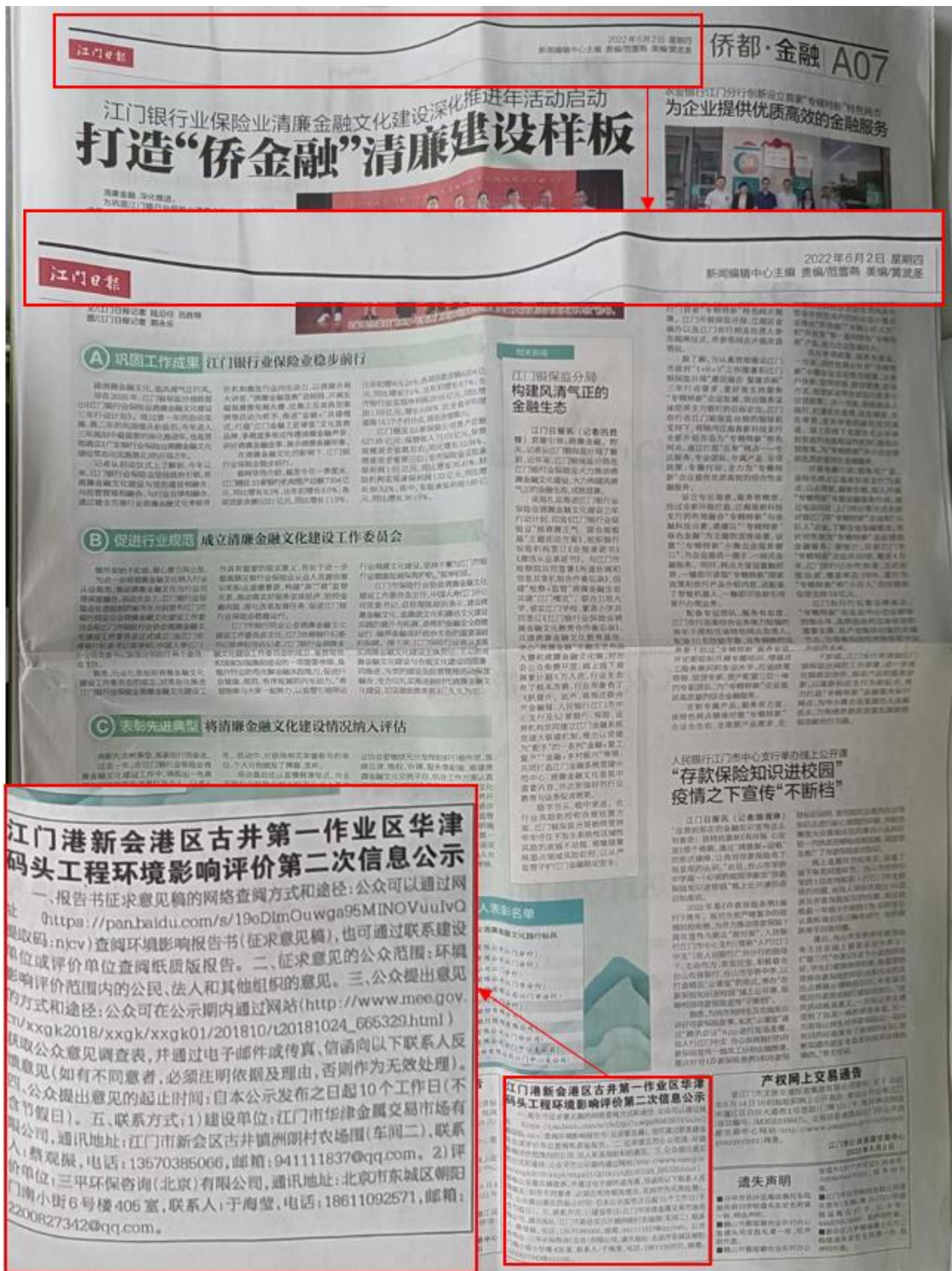
图 3.2-2b 征求意见稿第二次报纸公示