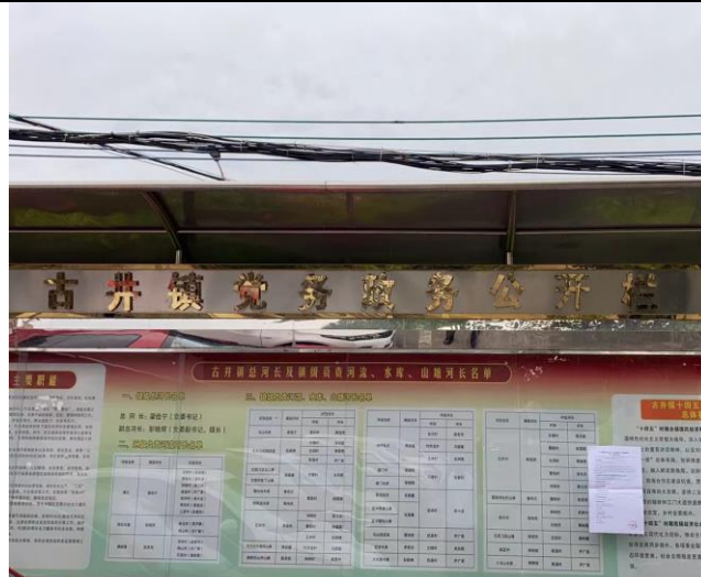
古井镇现场张贴照片