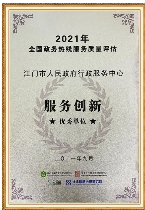
2021年9月，江门市人民政府行政服务中心获2021年全国政务热线服务质量评估服务创新案例优秀单位