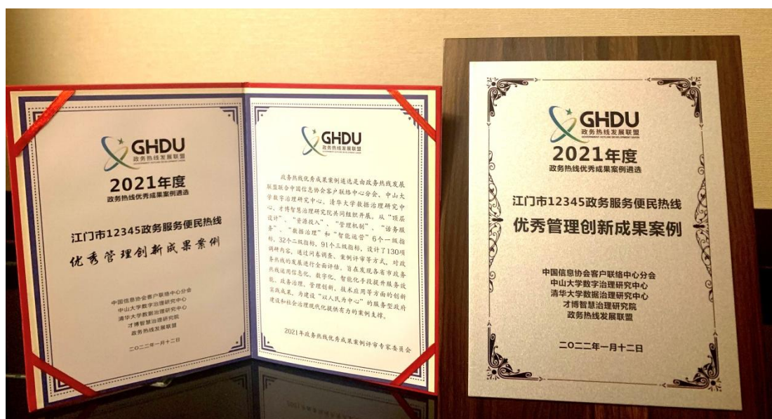
2022年1月，江门市12345政务服务便民热线荣获“2021年度优秀管理创新成果案例”奖