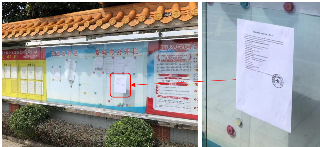
图 3.2-5 茶坑村张贴公示