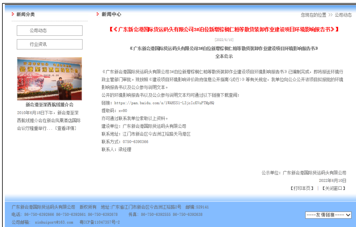
图 5-1 报批前公示截图