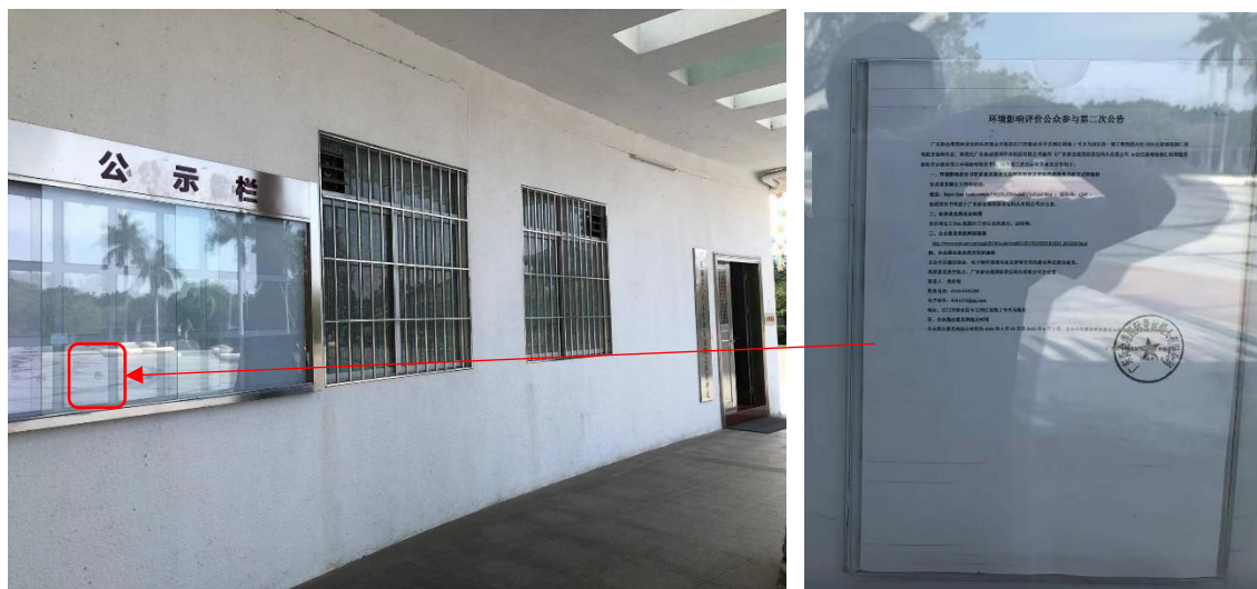
图 3.2-7 小鸟天堂国家湿地公园公示栏张贴公示