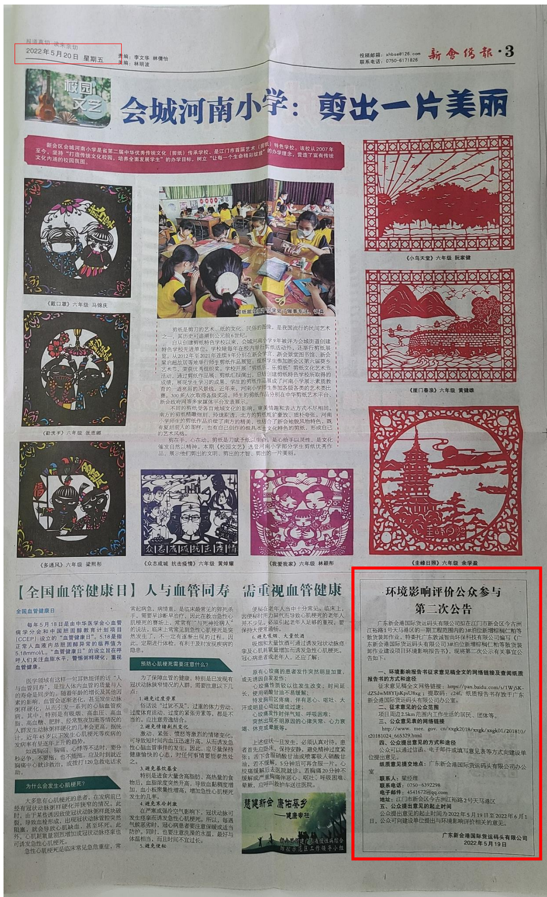
图 3.2-2 2022年5月20日报纸截图