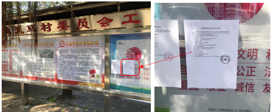
图 3.2-8 天马村张贴公示