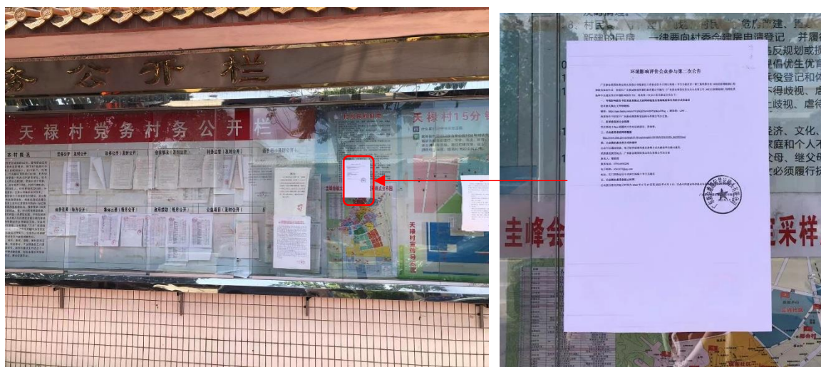
图 3.2-9 天禄村张贴公示

张贴区域选取的符合性分析：本项目征求意见稿公示选取本项目周边敏感点：西盛村、茶坑村、天马二村、小鸟天堂国家湿地公园、天马村和天禄村作为张贴区域，并于 2022 年 5 月 19 日至 2022 年 6 月 1 日连续公示 10 个工作日，符合《环境影响评价公众参与办法》（部令 4 号）要求：通过在建设项目所在地公众易于知悉的场所张贴公告的方式公开，且持续公开期限不得少于 10 个工作日。