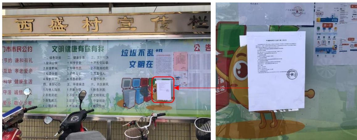
图 3.2-4 西盛村张贴公示

结合征求意见稿公示网上公示及报纸刊登公示，为方便当地居民了解项目信息，项目于2022年5月19日至2022年6月1日连续10个工作日易于接触的居民点公示栏张贴项目环评征求意见稿公示信息，公示照片详见下图。