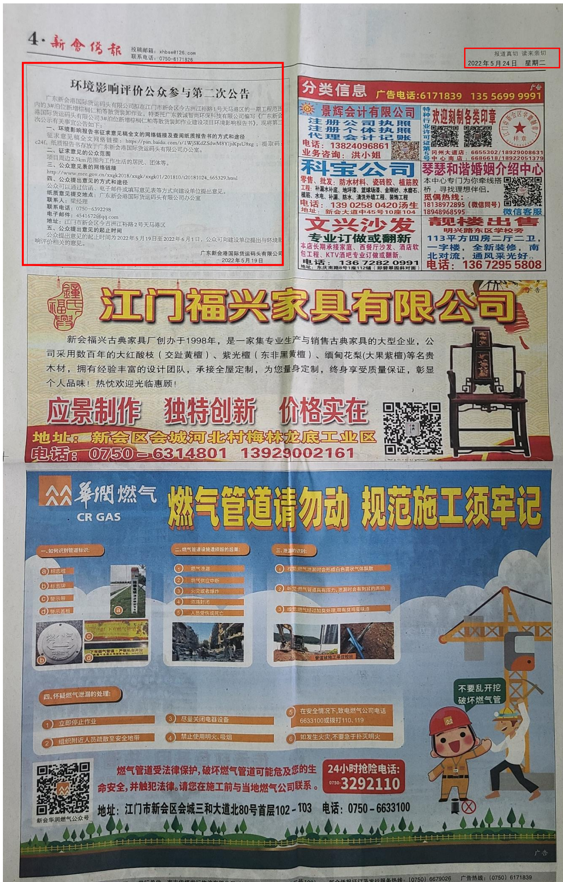
图 3.2-3 2022年5月24日报纸截图