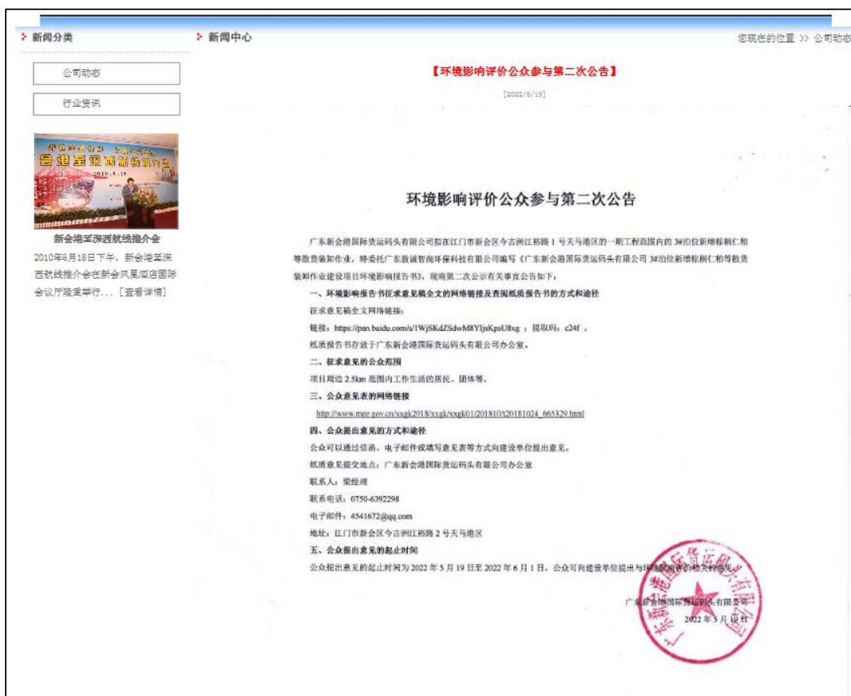
图 3.2-1 网站第二次环境影响评价信息公开截图