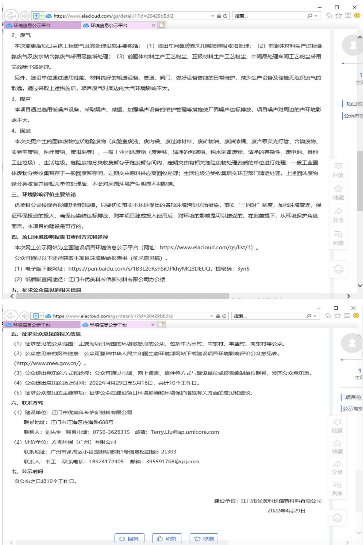
图 3-1 征求意见稿公示（全国建设项目环境信息平台）