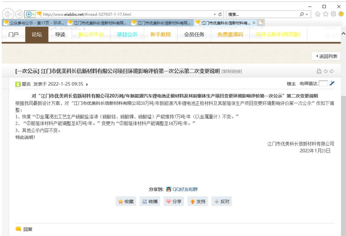
图 2-3 环评信息第一次公示第二次变更说明（环评互联网）