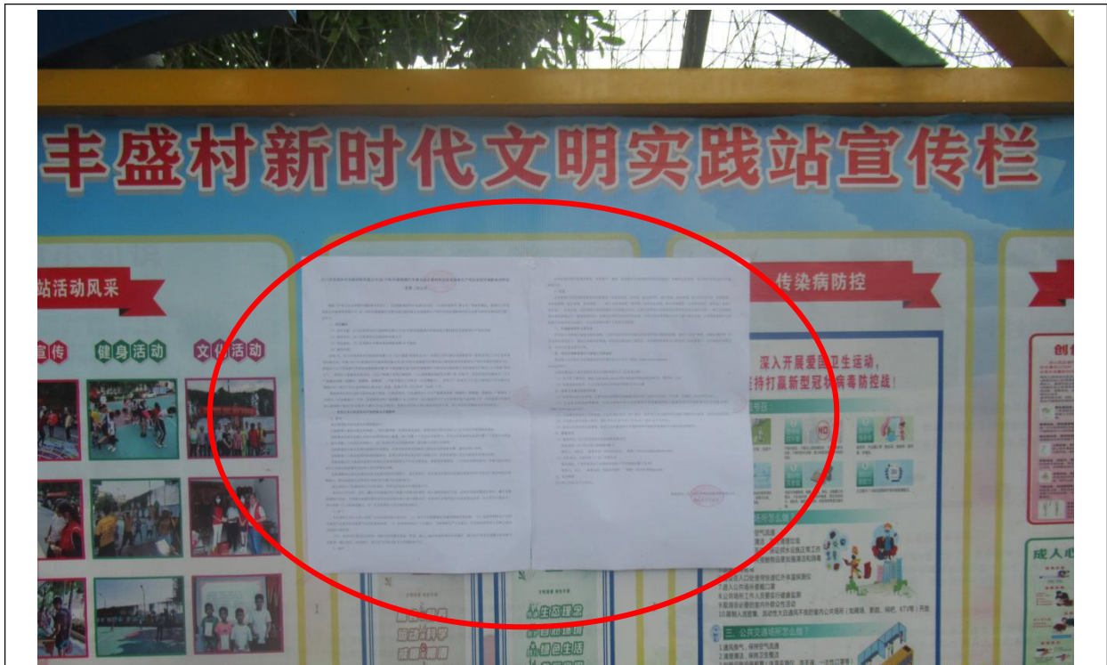
丰盛村第二次公示粘贴处