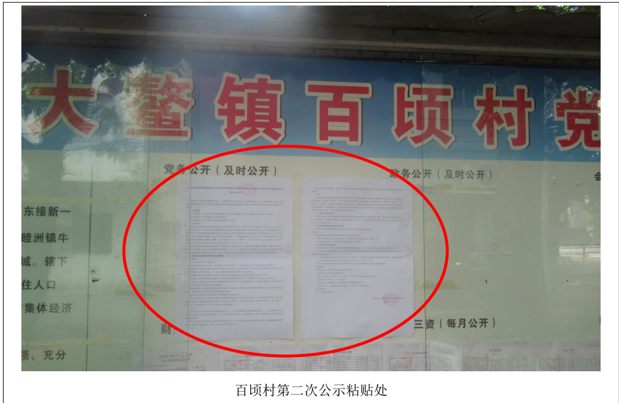
图 3-4 征求意见稿公示（周边敏感点张贴）