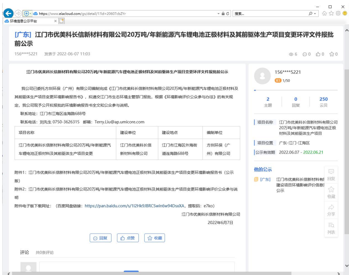
图 6-1 环评文件报批前网络公示截图

我公司于2022年6月7日在全国建设项目环境信息公示平台网上发布该项目环评文件报批前公示，网址为： https://www.eiacloud.com/gs/ ，网络公示情况截图如下：