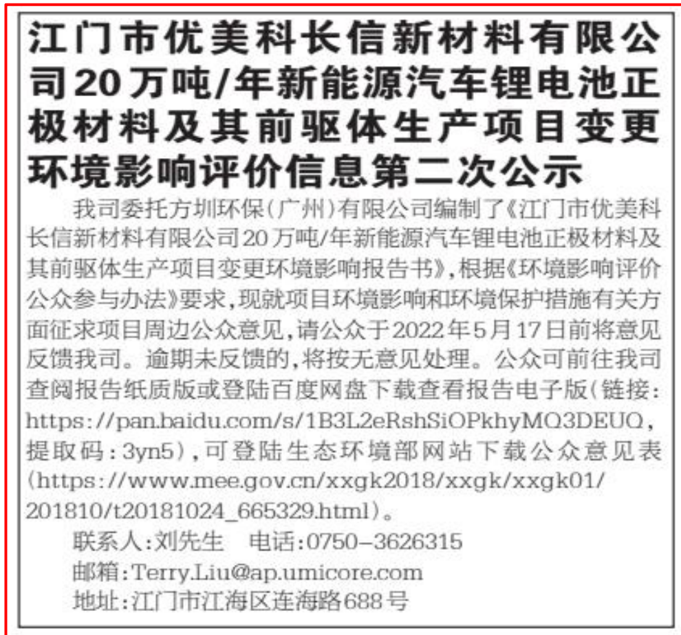
图 3-3 征求意见稿公示（江门日报 2022 年 5 月 14 日）