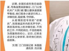
公安流调人员昼夜值守。

走进市公安局疫情防控专班办公室，一台台电脑屏幕不断闪烁，屏幕前是江门一个个忙碌的身影。电话、打印机、电脑键盘的声响此起彼伏，紧张、繁忙而又充满秩序的工作氛围扑面而来。