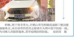
昨晚，雨下得非常大，在鹤山江北桥南路段路口便民核酸检测点，执勤的民警和志愿者们在大雨中坚守一线，为市民提供志愿服务，筑牢疫情防控防线。