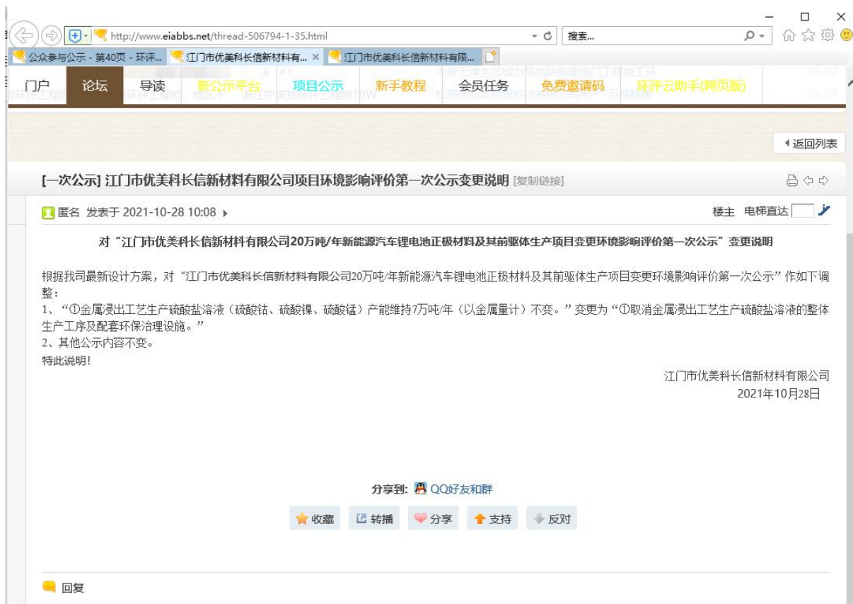
图 2-2 环评信息第一次公示变更说明（环评互联网）