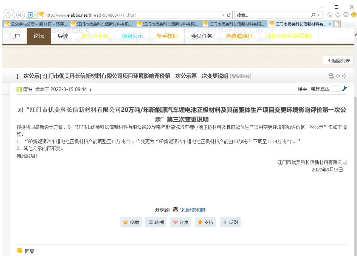
图 2-4 环评信息第一次公示第三次变更说明（环评互联网）

我公司于 2022 年 3 月 15 日在环评互联网网站进行环境影响评价信息第一次公示的第三次变更说明，网址为： http://www.eiabbs.net/forum.php ，网络公示情况截图如下：