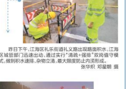
昨日下午，江海区礼乐镇礼乐社区出现路面积水，江海区城管局迅速出动，通过实行“清淤+提升”双向清淤模式，做到积水速排、杂沓立清，最大限度防止内涝形成。