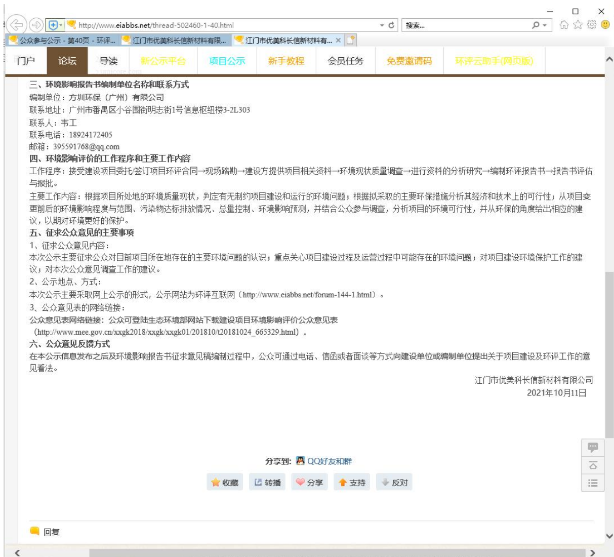
图 2-1 环评信息第一次网上公示（环评互联网）