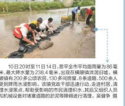
10日20时至11日14日，恩平全市平均降雨量为86毫米，最大降水为238.4毫米。出现在横岭镇洪洞村。横岭镇有200多户农户，130多亩农田，6家鱼塘，500余人受到降雨水浸影响。该镇党政干部迅速行动，走进村户，清理水浸农田，帮助受影响的村民清理积水。镇干部和机械装备对堵塞道路的淤泥等进行清理。