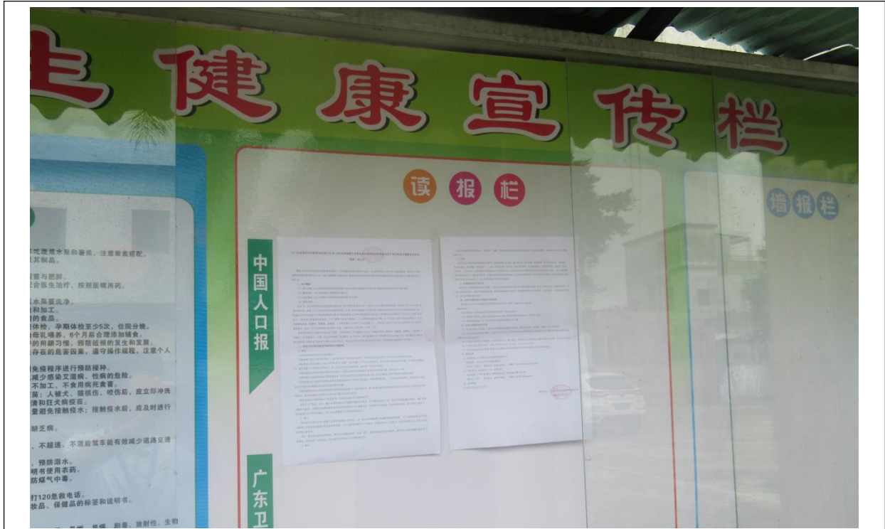
新一村第二次公示粘贴处