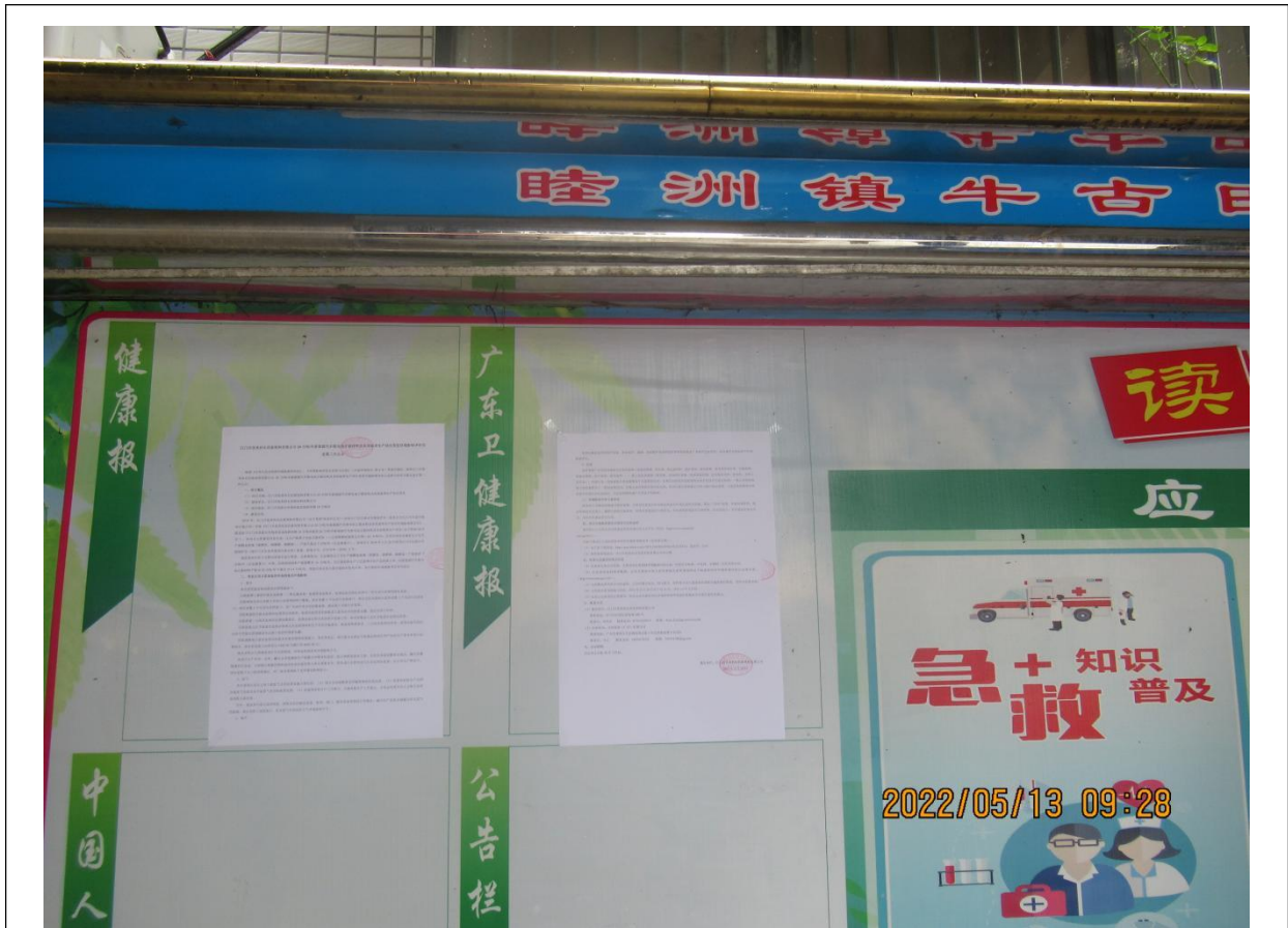
牛古田村第二次公示粘贴处