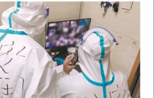
公安流调人员昼夜值守。

疫情防控常态化以来，新冠肺炎疫情在江门没有出现过本地社区传播，市公安局疫情防控专班超负荷运转的作用。民警需要以数小时为周期，在4小时内精准找到新冠病毒可能传播的途径、信息研判风险等级，下一步防控工作便超负荷运转，疫情防控工作专班超负荷运转。