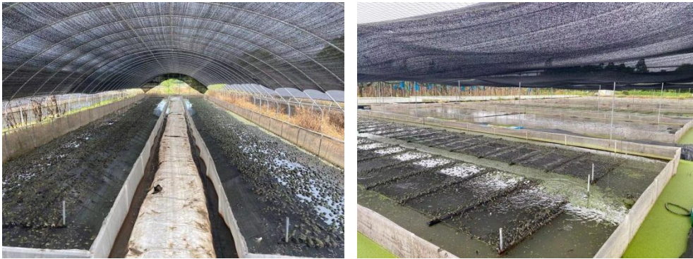
图 1-4 台山市养殖户陈建华考察情况

动物退出资金补偿到位，养殖户满意。养殖户主要成功转型养殖牛蛙，有少量泰国虎纹蛙人工养殖。