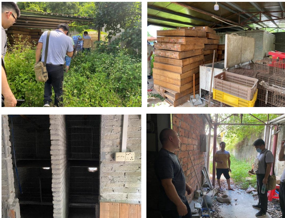
图 1-1 蓬江区根源蛇类驯养繁育场实地考察情况

评估小组和专家成员审阅了项目单位提交的自评材料，收集、整理与绩效评价项目相关的政策文件、管理办法、行业规范，主管部门发展规划、资金下达、预算分配等资料，并对项目进行必要的研究和分析，了解项目的立项背景。组织现场座谈对不详或有疑问的地方与项目单位进行现场沟通，还开展了对养殖户的实地访谈，以下为部分现场走访情况记录：