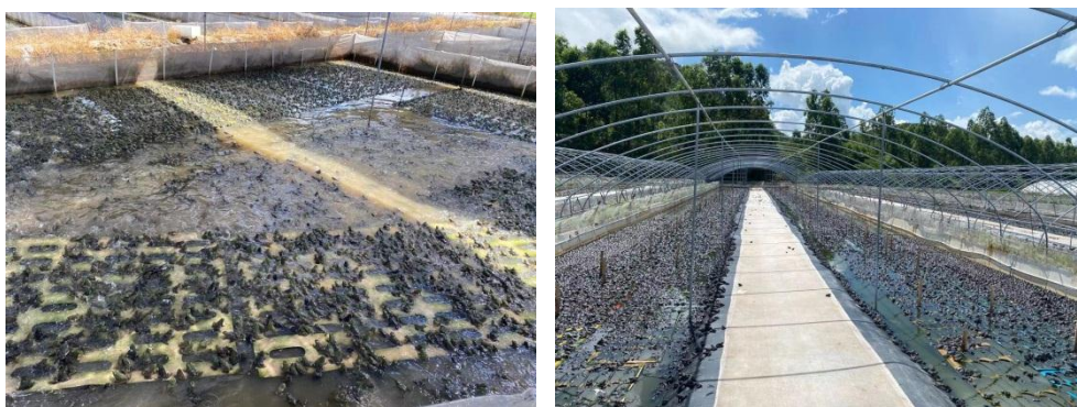
图 1-3 台山市斗山镇养殖户张镇聪考察情况

动物退出资金补偿到位，养殖户满意。养殖户希望积极转型，但迫于对鹭鸟的养殖技术要求较高，建议在养殖基地开展鸟类野生动物繁育、保护和救援工作，但需要合规的审批手续和相关政府部门支持。