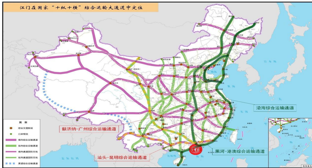
图 5-1 江门在国家“十纵十横”综合运输大通道中定位

建设对接港珠澳大桥、深中江阳通道、南沙大桥等珠江口高速公路过江通道。推进中山至开平高速公路等珠三角西岸重要高速公路建设，形成连接粤东西地区的深（圳）中（山）江（门）阳（江）大通道。推进广（州）中（山）江（门）高速公路等建设，形成连通广（州）佛（山）江（门）肇（庆）云（浮）的东西向通道，密切江门与顺德、南沙等联系。推进黄茅海跨海通道项目工作。提升高速公路互联互通水平，加强高速公路与沿江沿海港口、重要城镇、经济开发区、产业园区、城市新区、物流站场的连接。推进建设年限较早、交通繁忙的高速公路扩容改造和分流路线建设，提升既有高速公路通道容量。预留斗（门）恩（平）高速、广中江高速西延线等东西向通道资源。