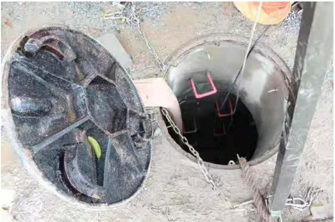
图3 A46#事故井现场照片