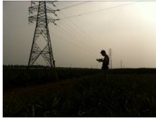
附图 6-8 现场监测照片