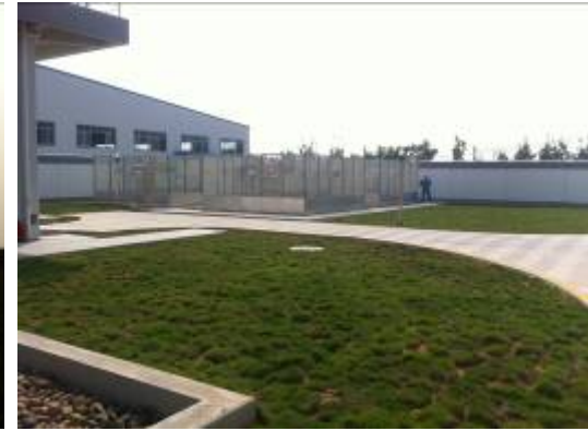
附图 6-9 110kV 苍山变电站内照片