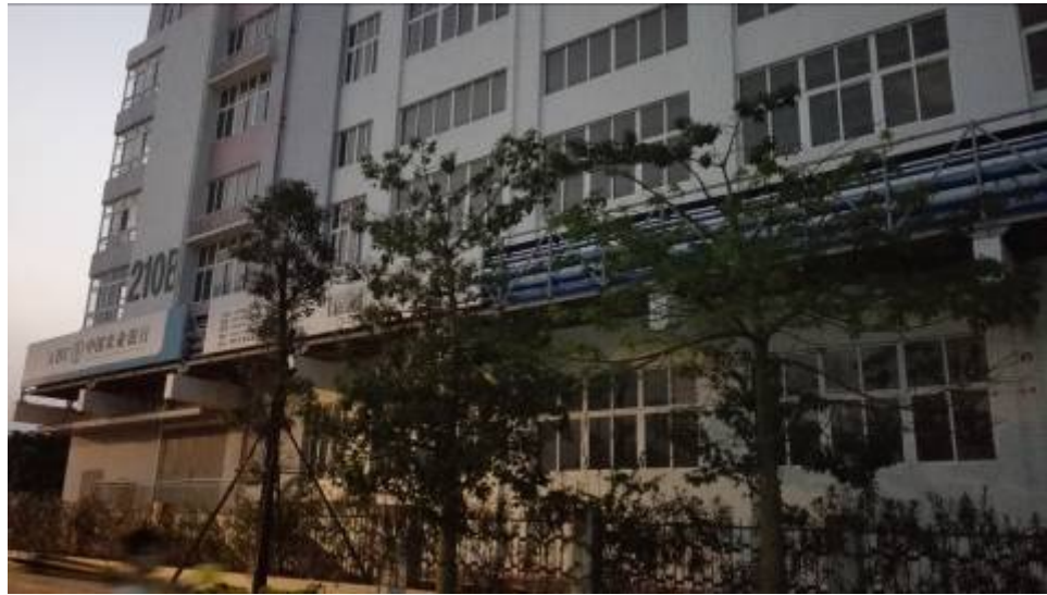
图 2-1 崖门电镀基地